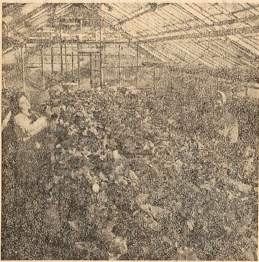
În serele Institutului de cercetări hortivite-cole-Băneasa