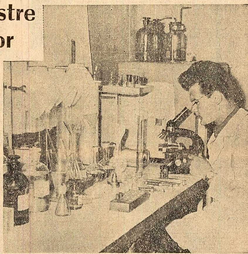
În laboratorul de înșămînțări artificiale al stațiunii

O atenție deosebită acordăm programului de hrănire, stabilind cantitățile de furaje ce se dau într-un timp și ordinea de distribuție a lor. Cantitatea de furaje prevăzută în rație și numărul de tainuri depind de producția de lapte. Odată cu creșterea producției de lapte, crește și cantitatea de furaje administrate pentru a asigura necesarul de substanțe nutritive. De exemplu, la vaca Zana, în a doua lună de lactație la o producție de 52—57 litri de lapte zilnic, concentratele s-au administrat în 4—5 tainuri.