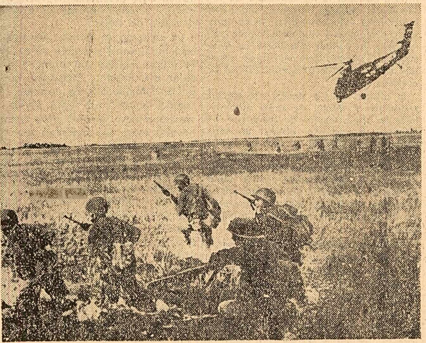
Lansate din elicoptere americane „HUS-1”, trupele diemiste, instruite și comandate de ofițeri americani, pornesc la „vîndicarea de oameni”.

SANAA. Forțele armate ale R. A. Yemen au primit ordin să se desfașoare de-a lungul granițelor Yemenului pentru a respinge orice agresiune saudită-irordanică. O nouă încercare a trupelor saudite de a pătrunde pe teritoriul Yemenului a fost respinsă de trupele yemenite. Agresorii au suferit mari pierderi în oameni și materiale, fiind siliți să se retragă în panică.