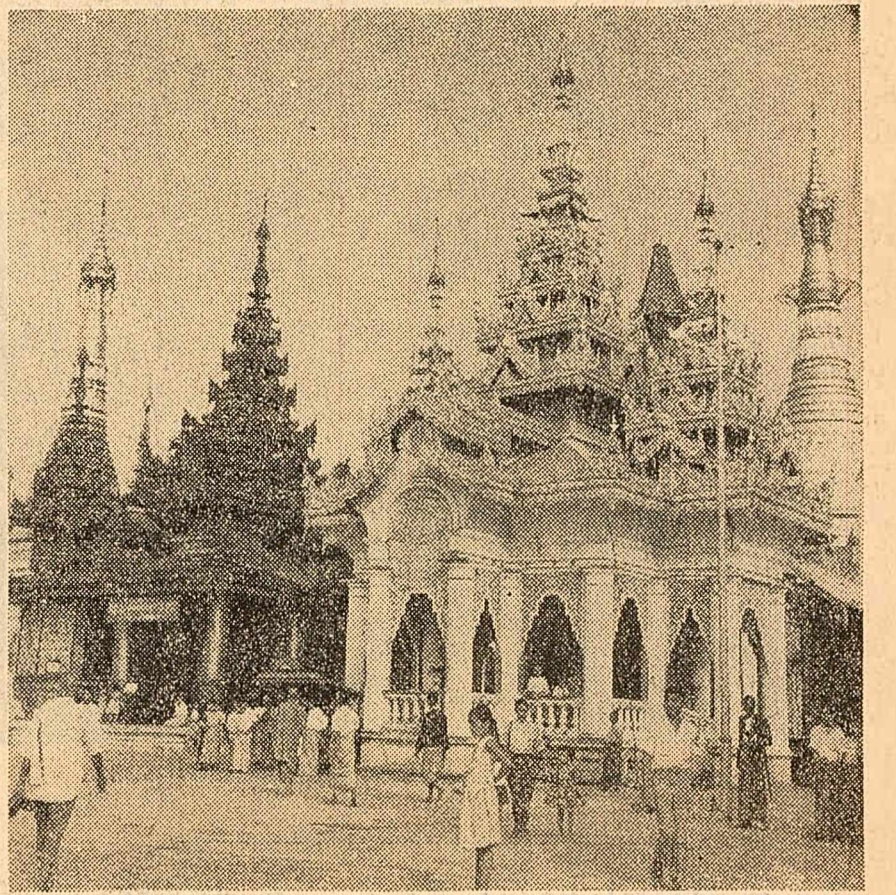
Velista pagodă de cur din capitala Birmaniei, Rangoon