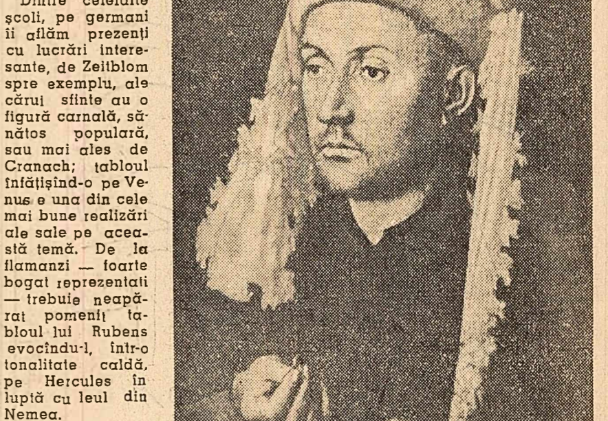
JAN VAN EYCK Omul cu lîncele albastru