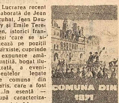
„Comuna din 1871”