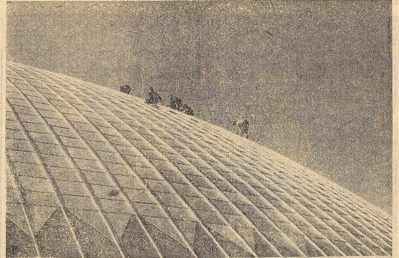
A. ROSENTHAL „Pe cupolă” (Premiul I) (De la expoziția de fotografii artistice „Viața nouă a patriei!”)