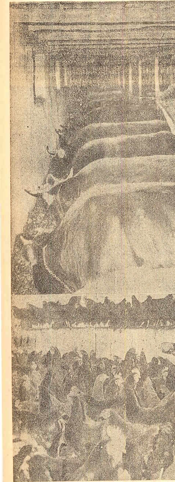
Deși adunarea generală nu s-a terminat, unii dintre colectivii au trebuit să plece la treburile lor care nu așteaptă amîna. La ferma de vaci (fotografia de sus), se împart porumbul însolat...