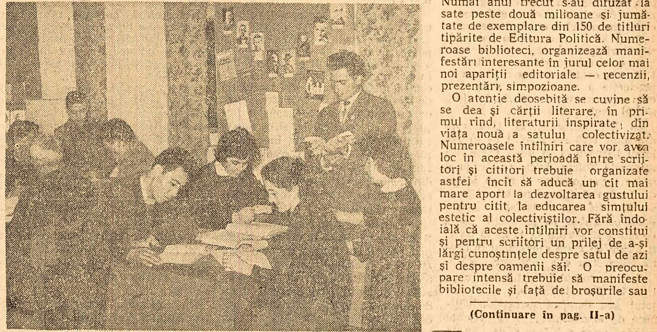
La biblioteca din comuna Crucea, raionul Hîrșova