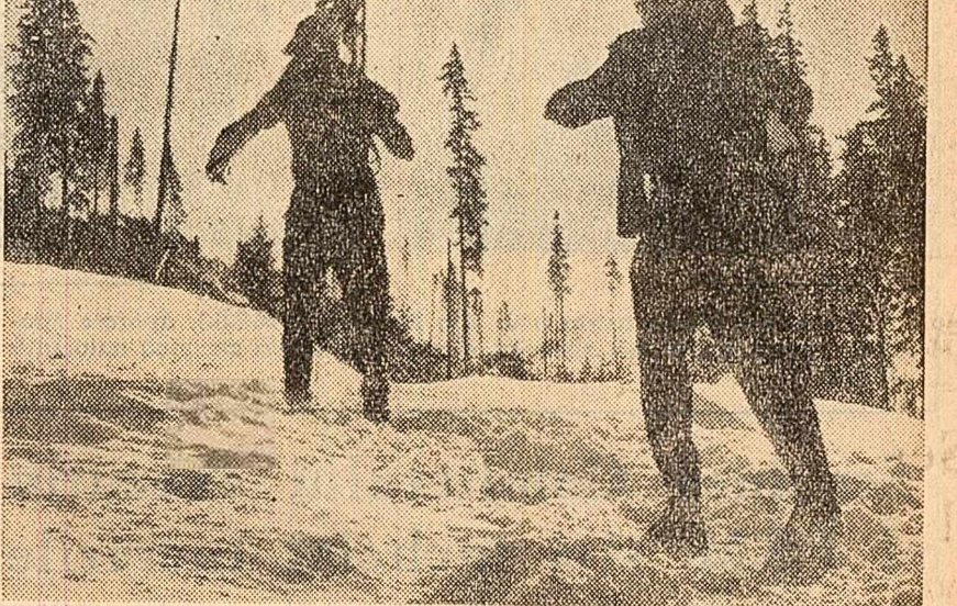
Spre pîrta de schi

Suprafața arabilă va crește anul acesta cu 6 000 hectare. În acest scop unitățile agricole vor trebui să termine în scurt timp lucrările de defrișare pe suprafețele stabilite. Se vor continua lucrările de organizare inter-gospodărească a teritoriului și se vor executa proiecte și documentații pentru amenajarea terenurilor erozate în vederea înființării de plantații de vii și pomi fructiferi. Numai anul acesta se vor planta în masiv 4 075 hectare cu pomi fructiferi și 1 059 hectare cu viță de vie.