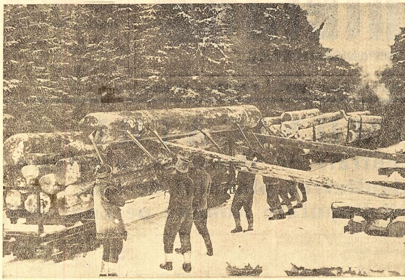
In acele zile de lărmă lucrul în exploatarea forestieră din regiunea Suceava se desfășoară fără întrerupere. Iată un aspect de la o gură de exploatare a I. F. Frasin: se încarcă bușteni de rășinoasă în vagoanele trenului C.F.F.

La căminul cultural din Duda, raionul Huși, a avut loc de curînd un concurs „Cine știe, câștigă” despre cultura porumbului și a florii-soarelui. La concurs au participat peste 500 de colectiviști. Bine pregătiți, concurenții au dat răspunsuri complete. Câștigătorii concursului au fost răsplătiți cu premii. După concurs, brigada artistică de agitație din satul vecin Pîhnești (comuna Arsura) a prezentat un program în fața colectiviștilor.