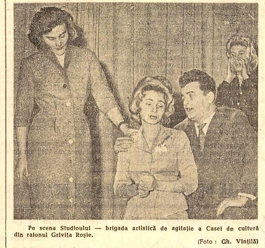
Pe scena Studioului — brigada artistică de agitație a Casei de cultură din raionul Grivita Roșie.