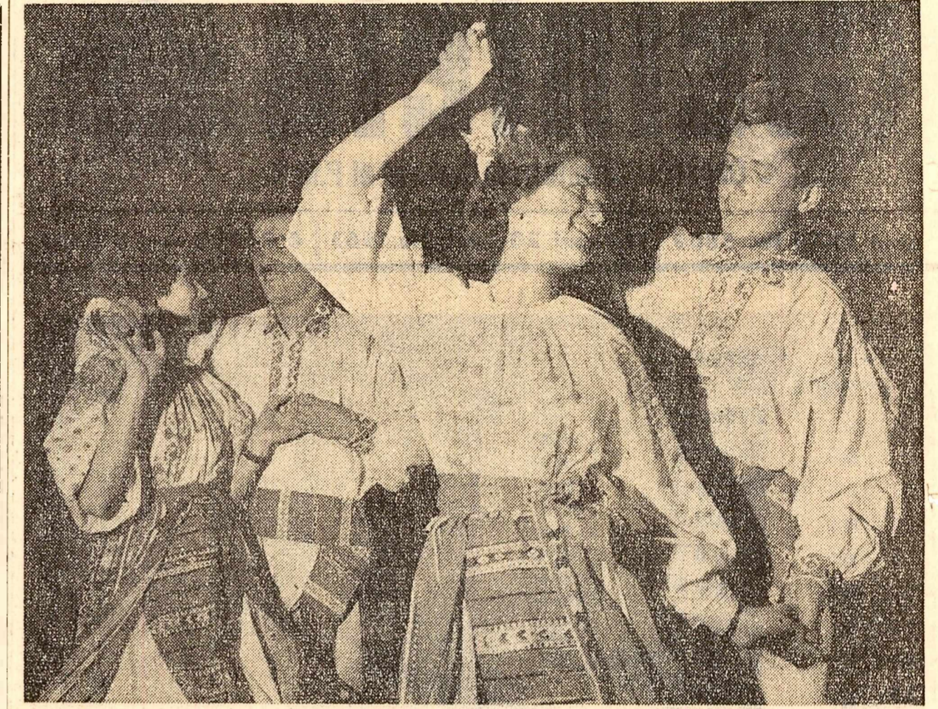
Echipa de dansuri populare a Casei de cultură din Predeal.