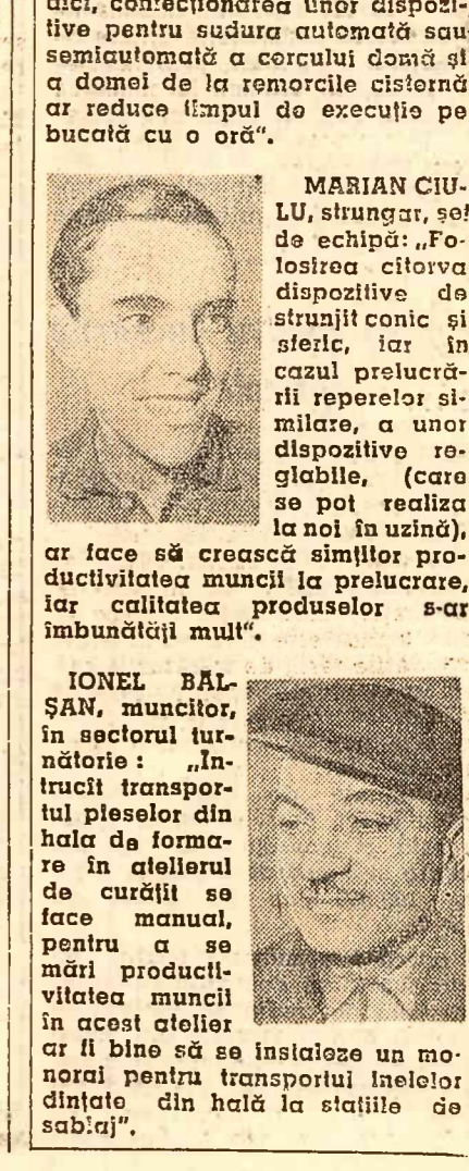
Lucrurile în echipă s-au dezvoltat și s-au îmbogățit de-a lungul timpului. În prezent, în uzina noastră, muncitorii lucrează în echipă...

Merită arătată că, obișnuiți cu un nivel înalt de productivitate a muncii, membrii echipei și-au sporit și clarificat.