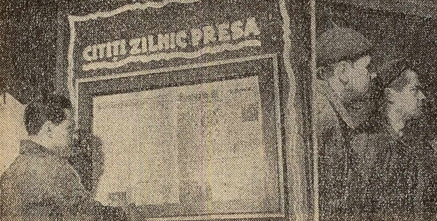
Organizația de bază se îngrijeste ca oamenii muncii din sector să fie informați asupra evenimentelor interne și internaționale.