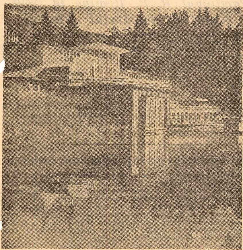
Locul Ursului din pitoreasca stațiune balneară Sovata