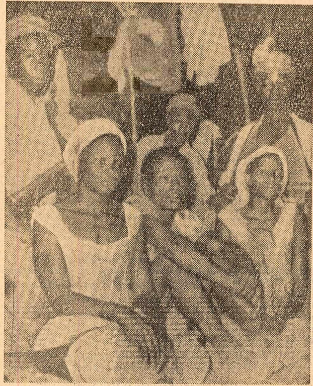
CAIRO 27 (Agerpres). — Baya Antonio Miguel, reprezentant al Partidului Mișcarea Populară pentru eliberarea Angolei, a declarat că în prezent lupta populară angoleză a intrat într-o nouă fază. „Poporul angolez, a arătat el, a fost nevoit să lupte cu arma în mână și este ferm hotărât să continue lupta împotriva jugului colonial, pentru dobândirea independenței”. În fotografie: Luptători și ștafete ale Armatei populare de eliberare din Angola într-un moment de odihnă în junglă.

MOSCOVA 27 (Agerpres). — Luind cuvântul la 27 aprilie în cadrul conferinței de presă de la ambasada americană din Moscova, Averell Harriman, secretar de stat adjunct al S.U.A., a declarat: „Sint pe deplin satisfăcut de rezultatele vizitei la Moscova”. Harriman a făcut cunoscut că a venit în Uniunea Sovietică pentru a se întâlni cu N. S. Hrușciov, președintele Consiliului de Miniștri al U.R.S.S., și cu A. A. Gromiko, ministrul afacerilor externe, pentru a discuta cu ei situația din Laos. El a spus că la Moscova a fost discutată numai problema laotiană, și cele două părți, după cum a subliniat el, au confirmat că sprijină pe de-a-ntregul acordurile de la Geneva pentru Laos.