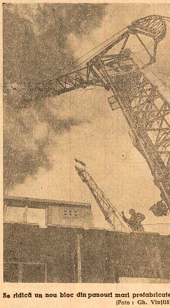
Se ridică un nou bloc din panouri mari prefabricate

Constructorii de locuințe ridică și alte probleme de care trebuie să se țină seama. Este vorba în primul rînd de coordonarea muncii celor trei șantiere din Valea Jiului. Aceste șantiere s-ar părea că n-au același organ tutelar — T.R.C.H. O mai bună coordonare a muncii acestor șantiere ar face să se evite situația că la Vulcan efectivul de constructori să fie cu mult sub cerințe, în vreme ce la Petroșeni se constată o situație inversă. Totodată, la Lupeni, dulgheri calificați lucrează la săpături, în timp ce la Casa de cultură din Petroșeni ritmul de lucru este redus tocmai din lipsa dulgherilor calificați.