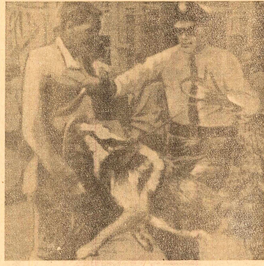
Fotografia de mai sus — un document al barbariei rasiste — dovedește „cît de bine” au fost dresați cîinii poliției din Birmingham pentru a fi asmuțiți contra negrilor.

De fapt, episodul păruiei din Caraimb dintre actualii și foștii favoriti ai S.U.A. arată din nou, dar poate mai evident decît altă dată, că pe cele nu-s mai bune decît sacul. Pe continentul latino-american există o serie de regimuri asemănătoare cu cel din Haiti (este vorba de dictaturile teroriste din Nicaragua, Guatemala, Salvador, Paraguay, Peru etc) pe care Washingtonul, în numele așa-zisei sale „Alianțe pentru progres”, ar vrea să le înlocuiască cu regimuri mai puțin compromise, pe care să le poată prezenta chiar sub eticheta de „democrație”. Numai