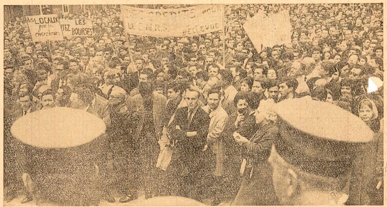
Profesori și studenți de la universitatea din Paris s-au întrunit pentru a protesta împotriva alocării bugetare inechitabile acordate învățămîntului superior. Pe pancarte se poate citi: „Vrem localuri pentru cercetătorii științifici”. „Să ni se acorde burse” etc.