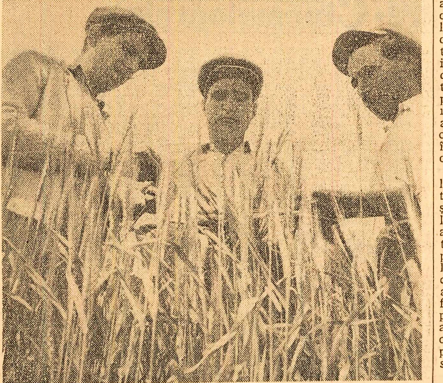
În aceste zile, la G.A.C. Spîncinea, regiunea Argeș, se execută recunoașterea în lan a culturii de grâu pentru alegerea celor mai bune parcele de pe care se va reține sămînța necesară recoltei anului viitor.