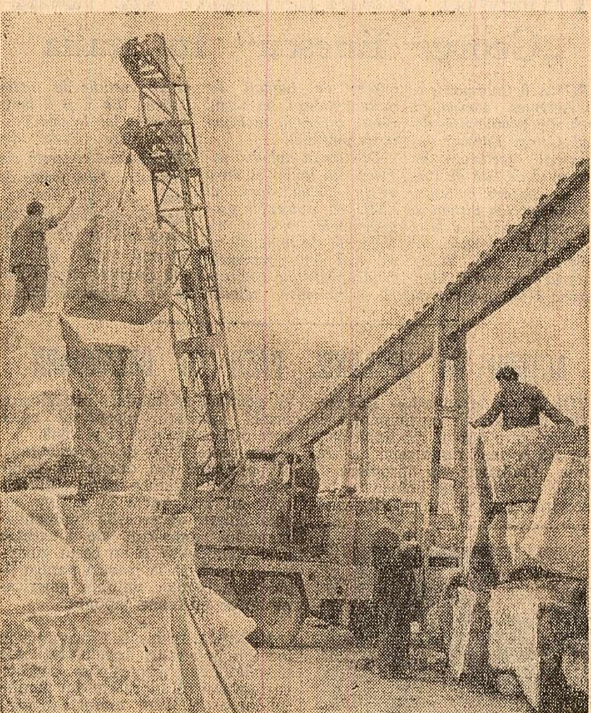
Intreprinderea de marmură din Simeria, regiunea Hunedoara. În fotografie: aspect din depozitul de marmură brută, înainte de prelucrare.