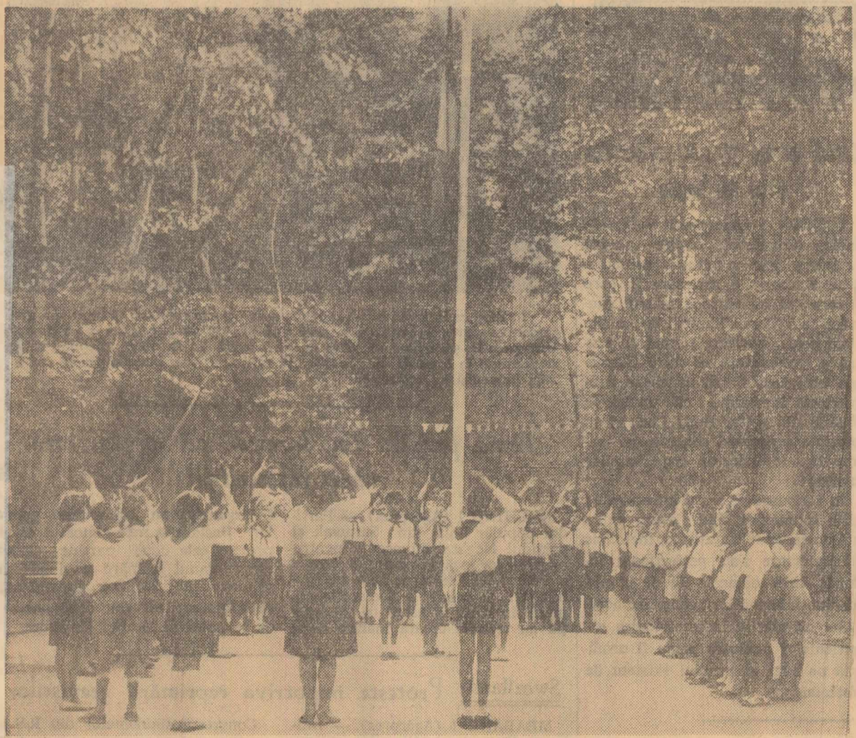
Se înalță drapelul. (În tabăra de vară pentru pionieri și școlari de la Buda-Argeș)