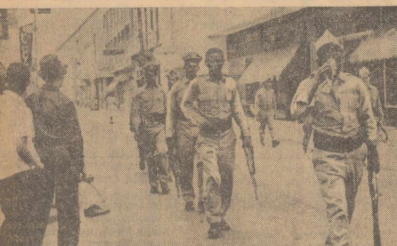
În Republica Dominicană continuă să domnească o profundă nemulțumire a maselor față de măsurile de reprimare luate de autorități. De teama manifestărilor populației, în principalele orașe ale țării au fost luate măsuri speciale de pază. Iată un grup de militari care patrulează cu arma în mînă pe străzile capitalei San Domingo. Este unul din aspectele cotidiene care fac ca indignarea populației să crească și mai mult.