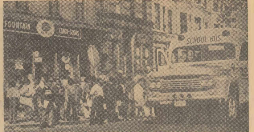
În timp ce în sudul S.U.A. populația de culoare continuă să lupte din greu împotriva segregării rasiale, în nord s-au obținut unele succese în ce privește integrarea în școli. Iată un grup de elevi negri din Brooklyn așteptând să fie transportați la o școală din Queens (alt cartier al New Yorkului) unde vor învăța împreună cu copiii albi.

Purtătorul de cuvânt al Casei Albe, Pierre Salinger, a anunțat că un comunicat comun va fi publicat la 2 iulie. El a precizat că în cursul întrevierii italo-americane de luni subiectul principal al discuțiilor l-a constituit proiectul american de crearea a forței nucleare multilaterale a blocului nord-atlantic.