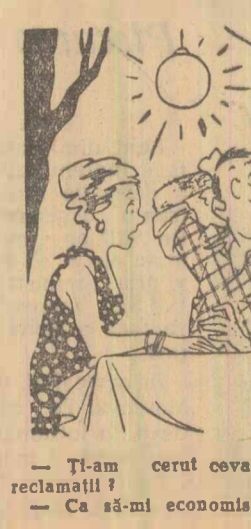
— Ți-am cerut ceva rece. De ce mi-ai aduc condica de reclamatii? — Ca să-mi economisesc un drum, că tot la ea ajungesei... (Desen de RIK AUERBACH)