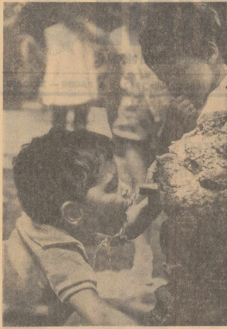
Te mai răcoștește...

În fața instanței, amatorului de cunoștințe întimplătoare i s-a oferit ocazia să completeze biografia prietenei sale cu date mai cuprinzătoare. A aflat de fișa de