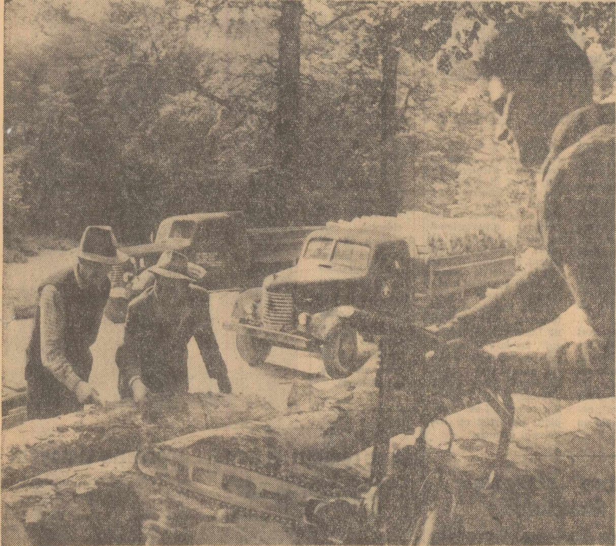
Exploatarea forestieră Bilita, regiunea Oltenia. La rampa de încărcare a buștenilor