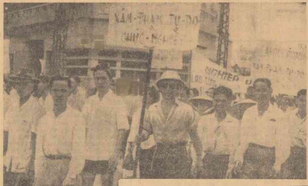
„Dien are de făcut față unui profund conflict politic cu majoritatea populației”, a transmis corespondentul din Vietnamul de sud al agenției americane U.P.I. Înfrunțînd cu curaj forțele represive, locuitorii din Saigon participă la demonstrații antiguvernamentale (vezi fotografia).

La una din uzinele societății „Hercules Powder”, producătoare de substanțe explozive din