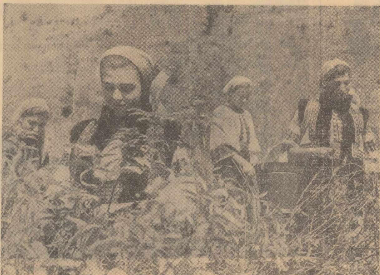
La cules de zmeură