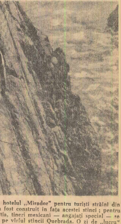
Nu întîmplător hotelul „Mirador” pentru turiști străini din Acapulco-Mexic a fost construit în fața acestei stînci; pentru a-i distruge pe aceștia, tineri mexicani — angajați speciali — se aruncă în apă de pe vîrfurile stîncii Quebrada. O zi de „lucru” prevede zece sărituri...

70.237 oameni — adică mai bine de 8 oameni la fiecare mie de locuitori ai Londrei — au suferit diferite accidente de circulație pe străzile capitalei engleze în anul 1962, se spune într-un raport al Direcției poliției, dat publicității la 15 august. Numărul cazurilor mortale în urma accidentelor este de 802, jumătate din accidentați fiind pietoni. În raport se subliniază că numărul accidentelor mortale a atins o cifră record în ultimii 5 ani.