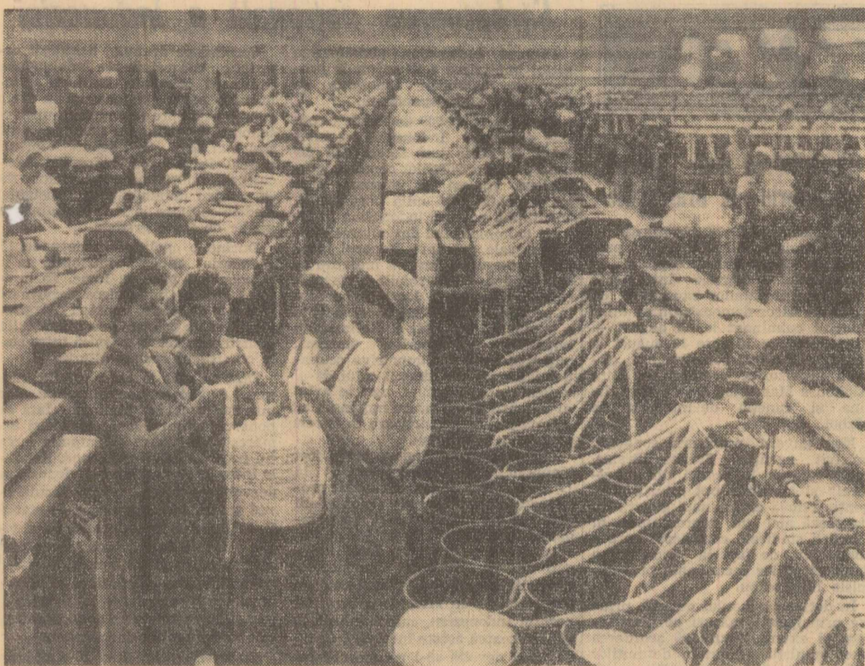
Filatura românească de bumbac — unitatea a II-a. In secția preparatie se dă o mare atenție îmbunătățirii calității. Luna trecută au fost date peste plan 6.400 kg de bumbac laminat de bună calitate. În fotografia un grup de muncitoare discutând despre legarea corectă a benzii laminate de bumbac.