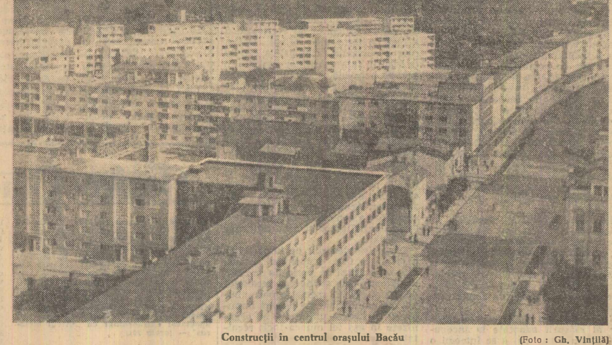
Construcții în centrul orașului Bacău