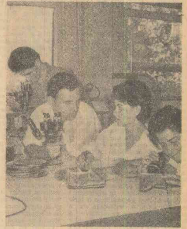
În timpul practicii în producție, un grup de studenți din anul IV al Facultății de metalurgie a Institutului politehnic din București lucrează într-unul din laboratoarele Uzinelor „23 August” din Capitală.

FLOIEȘTI (cosp. „Știință”). — Petroliștii din schelele Trustului de extracție Ploiești întîmpină ziua de 23 August cu însemnate realizări în producție. Extinzînd recuperarea secundară prin injecție de gaze și de apă în strat, aplicînd numeroase tratamente cu substanțe tensioactive, reactivînd 24 sonde din fondul inactiv, petroliștii din schelele Bercești, Cimpina, Berca, Băicoi și Urliuș au extras peste plan însemnate cantități de țîței. Pe întregul trust, productivitatea muncii a crescut în primele 7 luni ale anului cu peste 2 la sută față de plan.