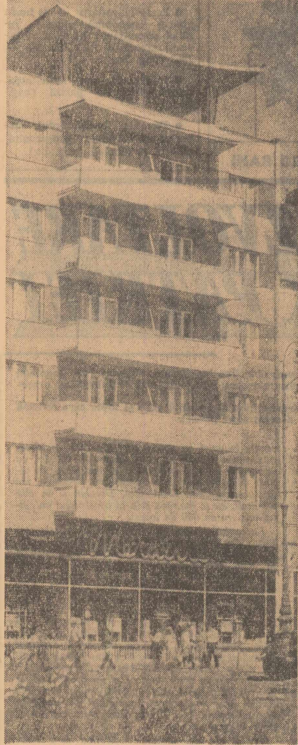
Unul din noile blocuri construite pe bulevardul Republicii din Arad.