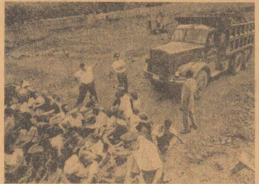
În S.U.A. continuă manifestațiile populației de culoare. Zilele trecute, la Elizabeth (New Jersey), negrii au organizat o grevă așezîndu-se în mijlocul drumului pentru a protesta astfel împotriva discriminării care se practica la angajarea muncitorilor din domeniul construcțiilor.