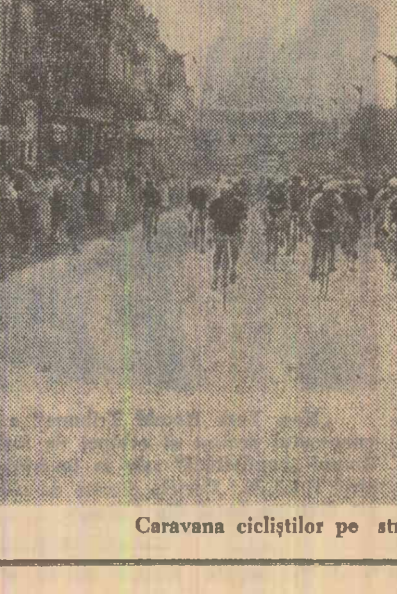
Caravana ciclistilor pe străzile Constanței

rițile multicolore ale ciclistilor angherași în întrecere, stîrneau pe drept cuvînt entuziasmul miilor de spectatori. Numeroși oaspeți din țări de mare tradiție în sportul pedalelor — R. D. Germană, Franța, Polonia, Cehoslovacia, mîrturisesc că au petrecut prima oară prilejul să urmărească o alergare în condiții atât de originale. Cuvîntul nu mai puțin elogioase, putem spune despre etapa Constanța-Tulcea. Frustrarea luptei sportive a fost amplificată parcă de varietatea peisajului, de repetatele ale plimbărilor pe rînd la orizont ogoare ale gospodăriilor colective, așezări pescărești. La Tarverde ca și la Baia, la Kogălniceanu ca și la Mihal Vițeazu și Babadag, spectatori-