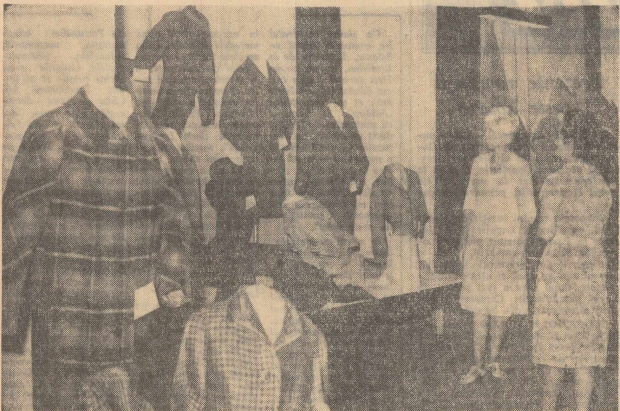
Aspect din expoziție

La fabrica de confecții și tricotate București s-a deschis de curând o expoziție înfățișând peste 1500 noi modele de confecții și tricotate ale anului 1964. Expoziția oglindește nu numai fantazia creatorilor, ci și marile posibilități ale industriei noastre de confecție de a realiza îmbrăcăminte originală, mai frumoasă, pentru toate circumstanțele și sezonale. Demurrile, completate cu misaje, pot fi transformate în halatane.