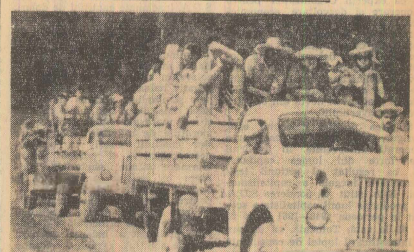
59 de studenți din S.U.A. s-au aflat timp de peste o lună în Cuba, (față în fotografie pe una din șoselele țării, mergînd să viziteze o localitate). La plecare din Havana ei au făcut declarații despre cele văzute în decursul vizitei lor. La sosirea la New York, studenții au fost înconjurați de polițiști pentru a-i feri de „contactul” cu publicul. Departamentul de stat le-a retras pasapoartele. Ei sînt pasibili de pedepse cu închisoarea și cu amenzi deosebite din cauza „interdicției” oficiale de a vizita Cuba.