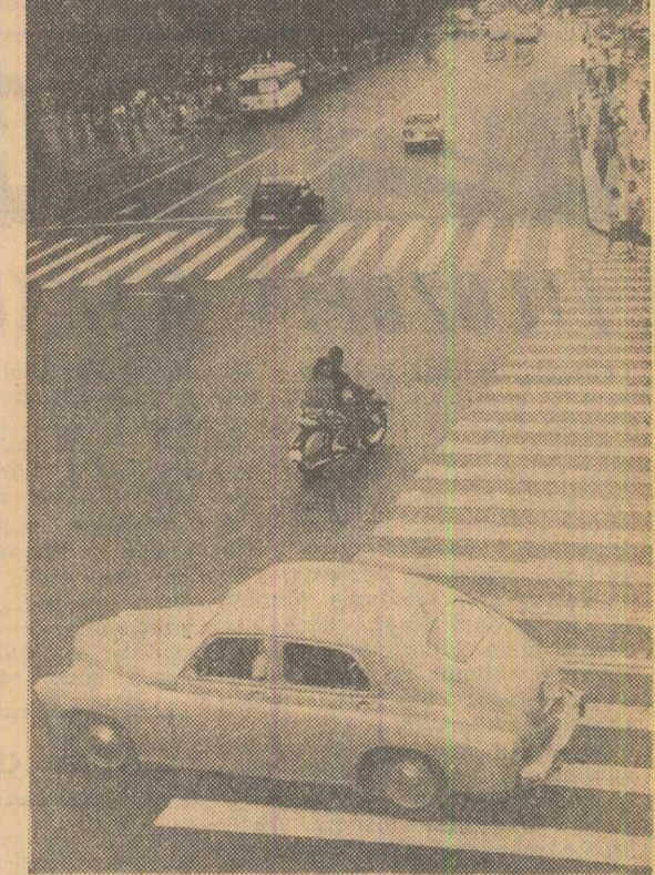
Pietonii trebuie să traverseze strada numai prin locurile marcate.

Printr-o decizie a Comitetului executiv al Statului popular al Capitalei, s-a hotărât ca și pe raza orașului București să se interzică semnalizarea prin clacsonare a autovehiculelor și semnalizarea prin clopote la tramvaie, alt zua cît și noaptea. Fac excepție de la această regulă autovehiculele pompierilor și salvării. Decizia intră în vigoare începînd cu ziua de 1 octombrie 1963. În acest scop s-au luat din vreme mai multe măsuri: tipărirea unor afișe și plante prin care se explică normele de circulație în oraș, constăturii cu conducătorii auto și pietonii; de asemenea, principalele bulevarde și străzi din București au fost marcate cu semne care ușurează circulația autovehiculelor și pietonilor.