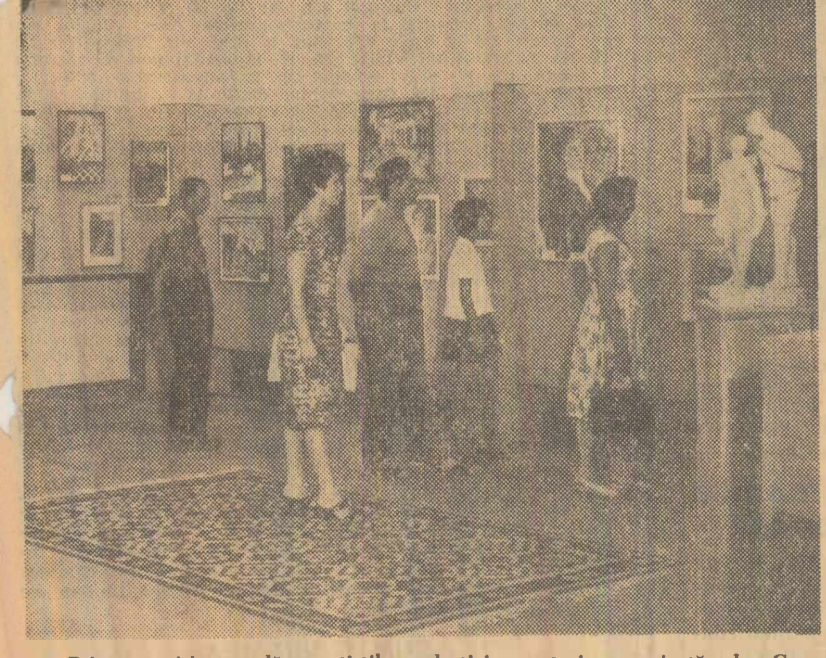
Prin expoziția anuală a artiștilor plastici amatori organizată de Casa creației populare a Capitalei, expoziția cuprinde peste 100 lucrări de pictură, grafică și sculptură.

În Capitală au fost terminate de curînd sau sînt în lucru noi construcții medico-sanitare. Astfel, au fost date în folosință un dispensar în strada Șchitu Măgureanu, un laborator de control al medicamentelor pe lângă Oficiul farmaceutic al Capitalei, precum și un centru stomatologic în cartierul Ciulești. Într-un local nou s-a mutat în speșia de stat a 4 circumscripții sanitare