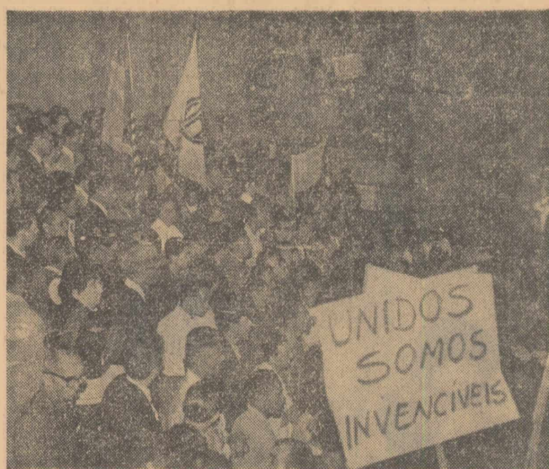
RIO DE JANEIRO. Peste 5.000 de oameni ai muncii din Brazilia au participat la mitingul în care s-au cerut „reforme structurale” în țară pentru a se opri cursul spre continua scumpire a traiului.

Publicația „Fuar Gazetelor Izmir”, apreciind sortimentul deosebit de bogat de exponate, subliniază perspectivele dezvoltării relațiilor economice romino-turce.