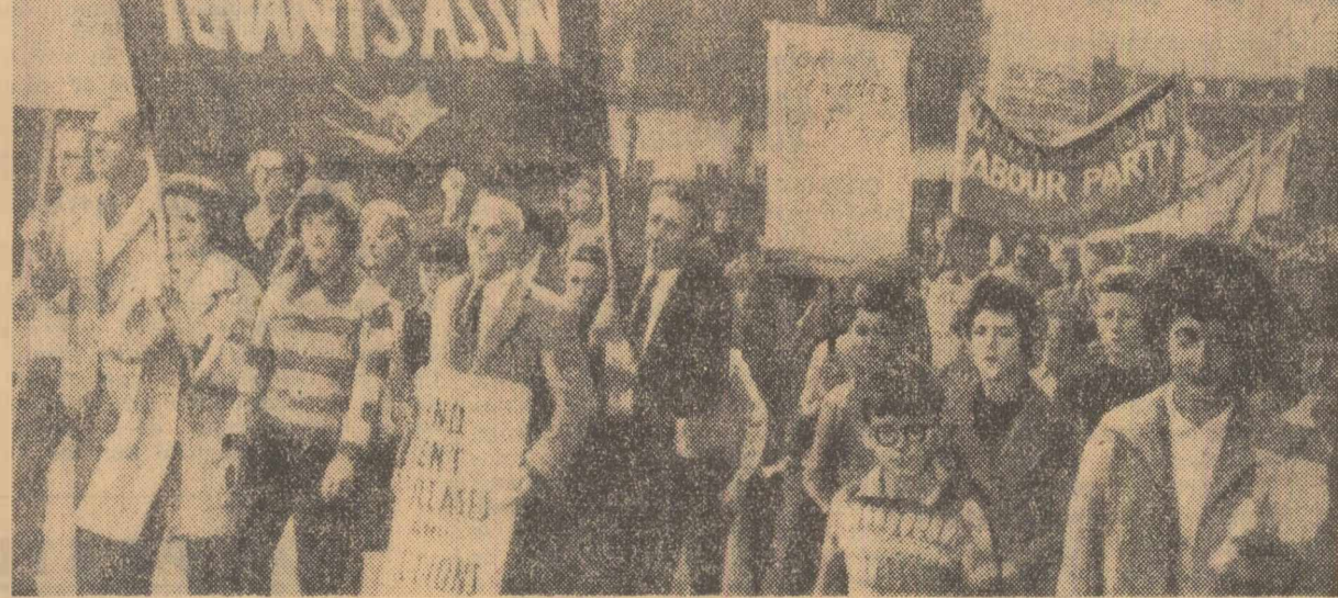
Chirișii din St. Stephen's Gardens, Londra, au organizat un marș de protest împotriva evaăurilor din locuințe și a scumpirii chiriilor.

După cum transmite agenția France Presse, „Congresul s-a deschis într-o atmosferă combativă”, datorită conflictului care opune pe secretarul general al TUC, George Woodcock, „singiul revendicativ”, condus de sindicatele minerilor și cazanșilor. Agenția amintește că raportul comitetului executiv cu privire la salarii, pe care Woodcock urmează să-l prezinte miercuri în fața congresului, cere muncitorilor „să limiteze sau să înceteze complet toate revendicările lor”, teză respinsă de sindicatele minerilor și cazanșilor, în numele cărora prezintă al TUC, Ted Hill, a prezentat o rezoluție cerind deplina libertate de acțiune sindicală. Potrivit agenției, această teză se bucură de sprijinul puternicului sindicat al muncitorilor metalurgiști și al Sindicatului muncitorilor din transporturi.