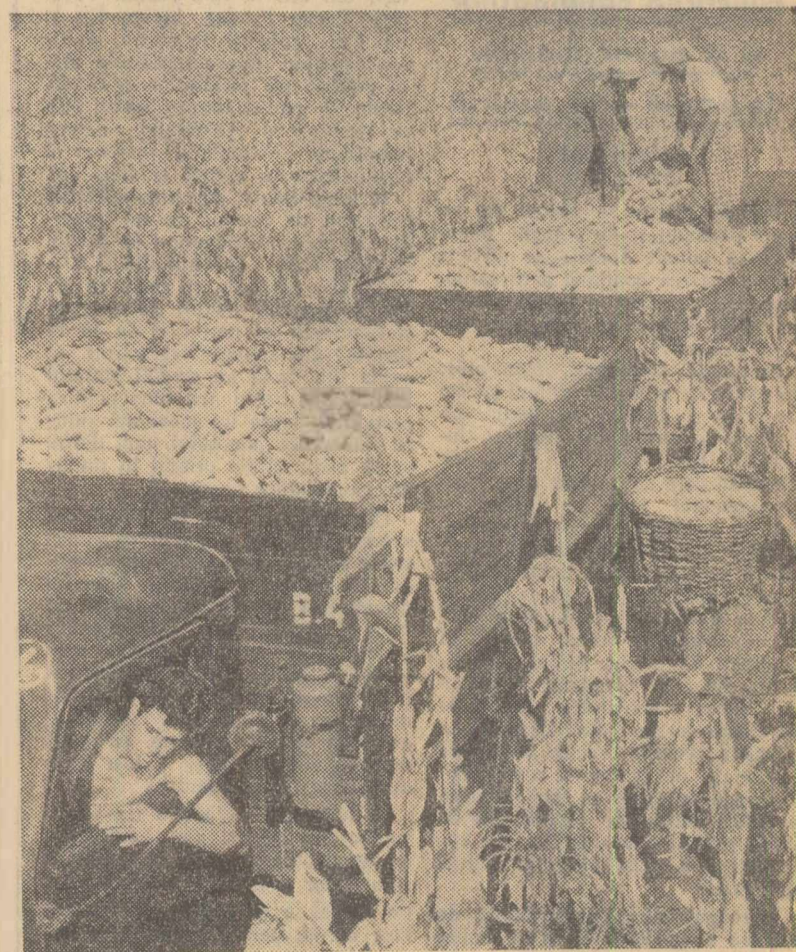
La G.A.S. Mihai Viteazu, raionul Giurgiu, recoltatul porumbului este în toi. Muncitorii au grijă să nu se piardă nici un bob.

O muncă intensă se desăfoară și în raionul Drăgănești-Vlașca. Colectiviștii din Gorneni cu de înămintat în această toamnă 530 de ha cu grâu, secară și orz. Intrucît o parte din grâu se va sămînța după porumb, s-a stabilit ca o dată cu recoltatul să se elibereze și terenul