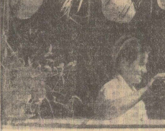
S-au deschis mustățile...