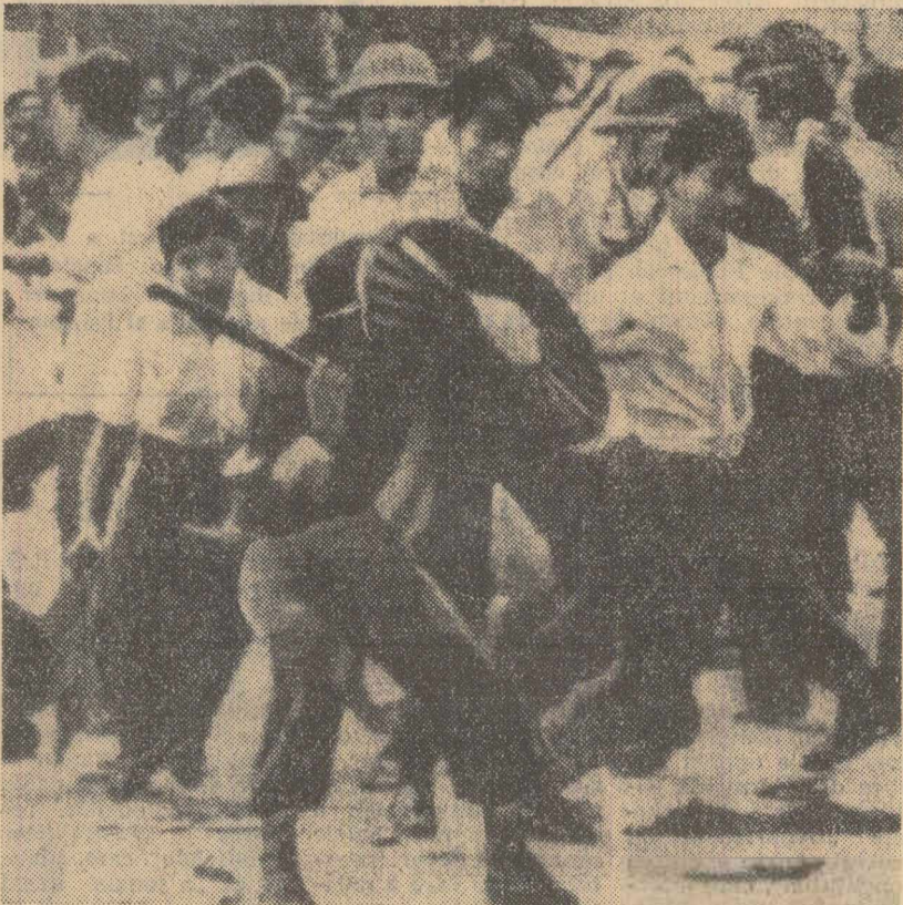
Aspect de la o demonstrație anti-diemistă, în timpul căreia poliția a intervenit cu brutalitate.

Senatorul democrat Frank Church a făcut de asemenea cunoscut că intenționează să răspundă Congresului un proiect de rezoluție care să prevadă suprimarea ajutorului acordat regimului diemist.