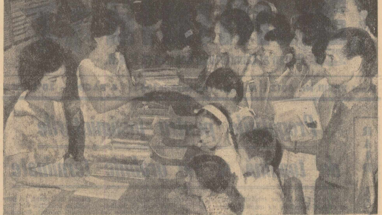
În curînd începe școala. Elevii își cumpără rechizite. Pentru mulți copii, acesta este unul dintre primele contacte cu viața școlară, una dintre primele emoții plăcute legate de ea.