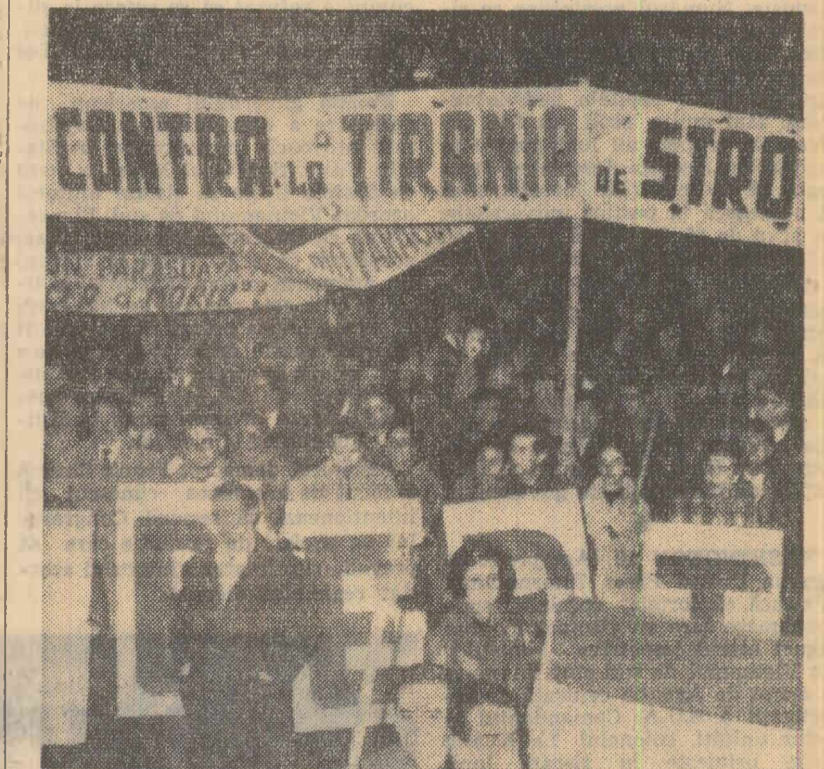
Demonstrație de protest a studenților din Montevideo împotriva „relegerii” dictatorului Stroessner în funcția de președinte al Paraguayului.

NEW YORK 10 (Agerpres). — Consiliul de Securitate a continuat luni după-amiază examinarea problemei situației din Rhodesia de sud. În cadrul ședinței au luat cuvântul reprezentanții Republicii Mali și Republicii Arabe Unite, care au expus punctul de vedere al țărilor africane în această problemă. Reprezentantul Republicii Mali, Sori Coulibaly, a declarat că obiectivul principal al minorității albe care guvernează în Rhodesia de sud este de a instaura un regim de apartheid. El a subliniat că Marea Britanie va crea o situație periculoasă în Africa, dacă va transfera guvernului minorității albe atribuțiile sale. Luând apoi cuvântul reprezentantului Republicii Arabe Unite, Mahmud Riad, a arătat că prin hotărârile de a transfera toate atribuțiile sale guvernului rasist al Rhodesiei de sud, guvernul britanic ignorează apelurile sefulor celor 32 de state africane și recomandările O.N.U. În aceste condiții, a spus reprezentantul R.A.U., există un pericol grav și imediat pentru pacea și securitatea Rhodesiei de sud și a întregii Africi, ceea ce impune adoptarea unor acțiuni urgente din partea Consiliului de Securitate.