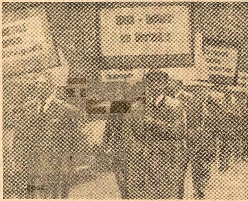
Metalurghiști vest-germani demonstrează împotriva proiectelor de legi excepționale pregătite de autoritățile R.F.G.

NEW YORK 1 (Agerpres). — Secretarul general al Organizației Națiunilor Unite, U Thant, a oferit în seara zilei de 30 septembrie un dineu în cinstea miniștrilor afacerilor externe ai U.R.S.S., S.U.A. și Marii Britanii, care participă în momentul de față la sesiunea Adunării Generale. Cu acest prilej, după cum subliniază agenția France Presse, între cei trei miniștri de externe a avut loc un schimb de vederi în legătură cu „problemele asupra cărora s-ar putea ajunge la o înțelegere pentru a continua desîntinderea între Est și Vest”.