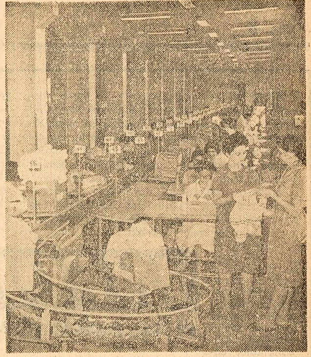
La Fabrica de tricotate din Cluj a fost dată în funcțiune o nouă secție. Ea este dotată cu două benzi de lucru și mașini de cusut moderne. Prin aceasta se realizează o producție sporită de tricotate și se îmbunătățește calitatea. În fotografie: Aspect din noua secție.

La Uzinele „23 August” din Capitală, colectivul grupei de mecanizare a proiectat și executat o serie de dispozitive complexe ca: mecanisme de rotii piesele grele, cu viteze variabile, dispozitive de manipulare port-flux etc., cu ajutorul cărora s-au mecanizat liniile de sudură. Acestea, pe lângă că au ușurat simțitor munca sudorilor, au contribuit și la extinderea procedurii de sudură automată în uzină. Laminoriiști de la „Republica” au introdus în procesul de producție un aparat cu ajutorul cărui se poate controla la cald diametrul exterior al țevilor. Acesta a mărit simțitor productivitatea muncii, permițând totodată extinderea metodei de laminare la toleranțe negative.