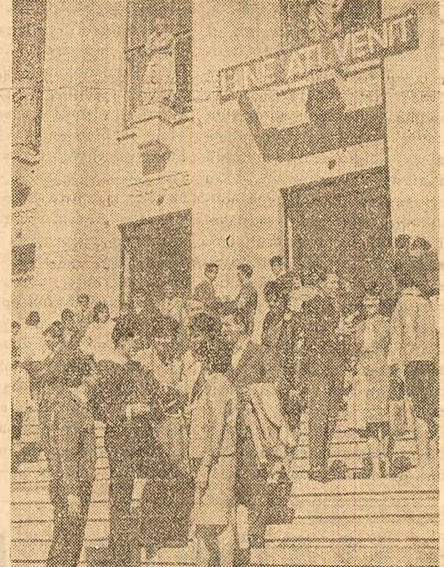
După o vacanță plină de amintiri reînțînirea cu colegii este emoționantă.