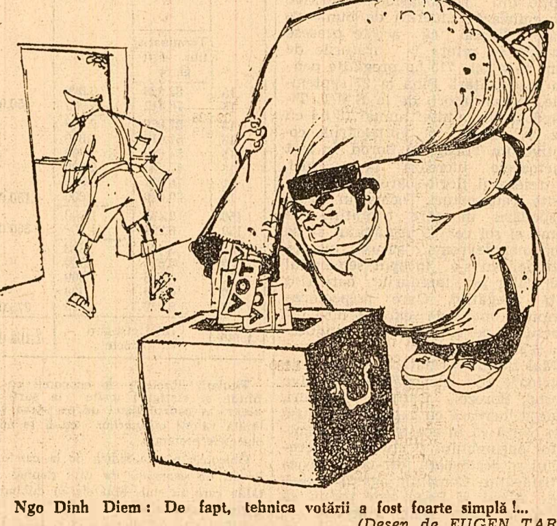
Ngô Dinh Diem: De fapt, tehnica votării a fost foarte simplă!...

Comentariu rezultatele alegerilor, oficialitățile sud-vietnameze au declarat că „alegătorii” n-au înțeles tehnica votării.