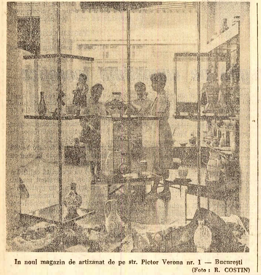
În noul magazin de artizanat de pe str. Pictor Verona nr. 1 — București