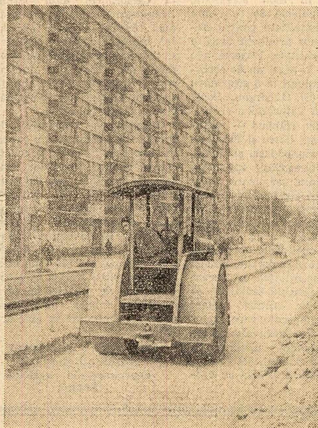
Pe șoseaua Viilor din Capitală se pregătește terasamentul liniei de tramvai care va face legătura între Calea Șerban Vodă și șoseaua Panduri...