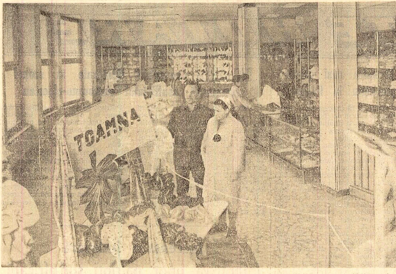
Interiorul noului magazin univ. sal din comuna Râșinari, raionul Sibiu.