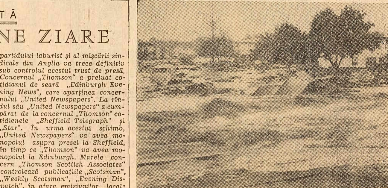
La Baldwin Hills (California, S.U.A.) s-a rupt un puternic baraj provocându-se imense pagube. Sute de case au fost distruse. S-au înregistrat morți și răniți. Intregul ținut a fost declarat „regiune devastată”. În fotografie: După ruperea barajului.