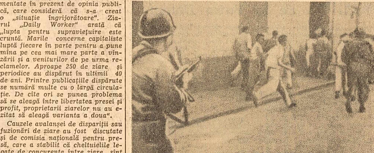
Ascuțirea crizei politice din Republica Dominicană s-a desfășurat paralel cu un nou val de repressii antidemocratice declanșate de actualii guvernanți. În fotografie: Pe străzile capitalei țării, Santo Domingo, poliția intervine pentru a împărștia o manifestație de protest împotriva prigoanei politice.

În ultima vreme, în provincia sud-vietnameză Loung An au avut loc lupte între detașamentele de patrioți ale Frontului de Eliberare și unitățile de repressiune ale regimului de la Saigon. Trupele guvernamentale au suferit mari pierderi în oameni și tehnică de luptă.