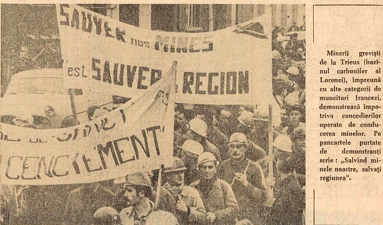
Minerii greviști de la Trioux (bazinul carbonifer al Lorenei), împreună cu alte categorii de muncitori francezi, demonstrează împotriva concedierilor operate de conducerea minelor. Pe pancartele purtate de demonstrații scrie: „Salvând minele noastre, salvați regiunea”.