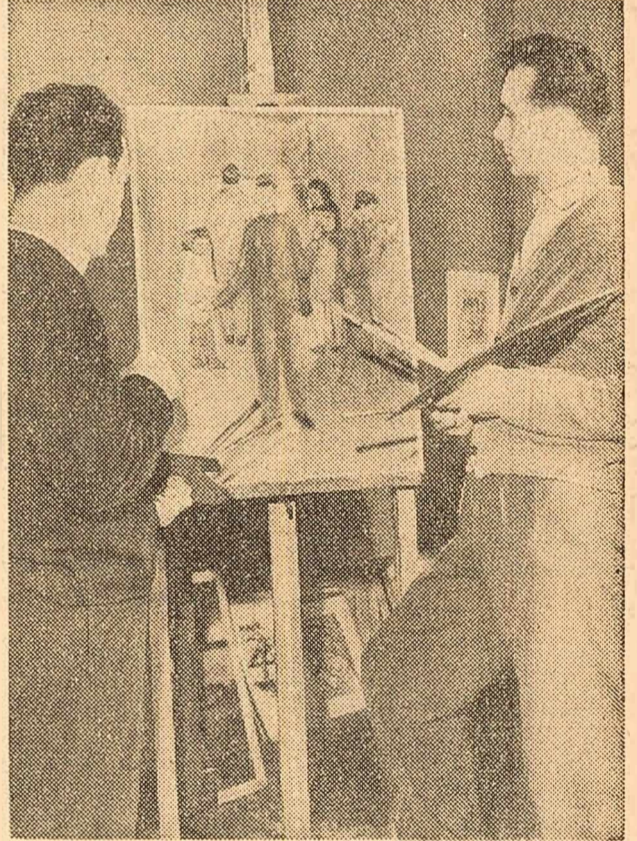
În fața șevaleților

Planul de măsuri tehnico-organizatorice stabilite de colectivul Șantierului naval Oltenița prevede, între altele, extinderea cu 45 la sută a sudurii automate și semiautomate, montarea unei mașini de indoit țevi și a unei macarale de 35 tone, folosirea pe scară largă a materialelor sintetice, îmbunătățirea controlului calității sudurii etc.