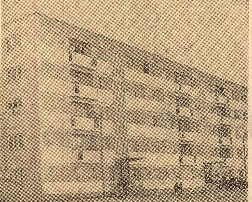
Unul din blocurile construite pe Aleea Trandafirilor din Tirgoviște, dat recent în folosință.

ODORHEI (coresp. „Științei”). — În aceste zile, la S.M.T.-Odorhei se lucrează de zor la repararea tractoarelor și mașinilor agricole. În acest scop, în afară de cele 3 posturi specializate de reparații, au mai fost organizate încă 3 asemenea posturi, dotate cu scule, dispozitive și instru-