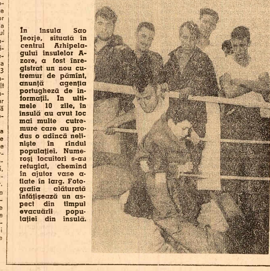
În insula Sao Jorge, situată în centrul Arhipelagului insulelor Azore, a fost înregistrat un nou cutremur de pământ...