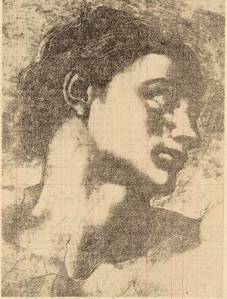
ADAM, fragment din picturile de la Capela Sixtina.

nică: oamenii lui Michelangelo nu i se sustrag niciodată. Iată stătuia vestită a Noapții, capul ei care se înclină lent pe umăr, într-o splendidă voluptă.