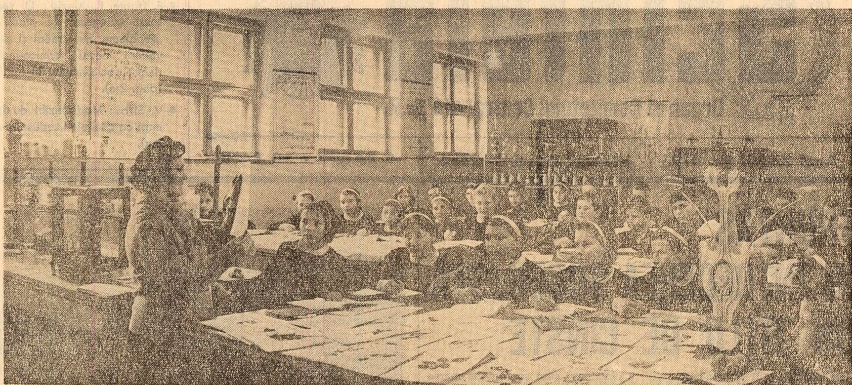
Elevii ai școlii tehnice horticole de pe lângă Stațiunea experimentală hortivitică din Miniș la o oră de laborator

Vasile SÎRBU vicepreședinte al Statului popular regional București