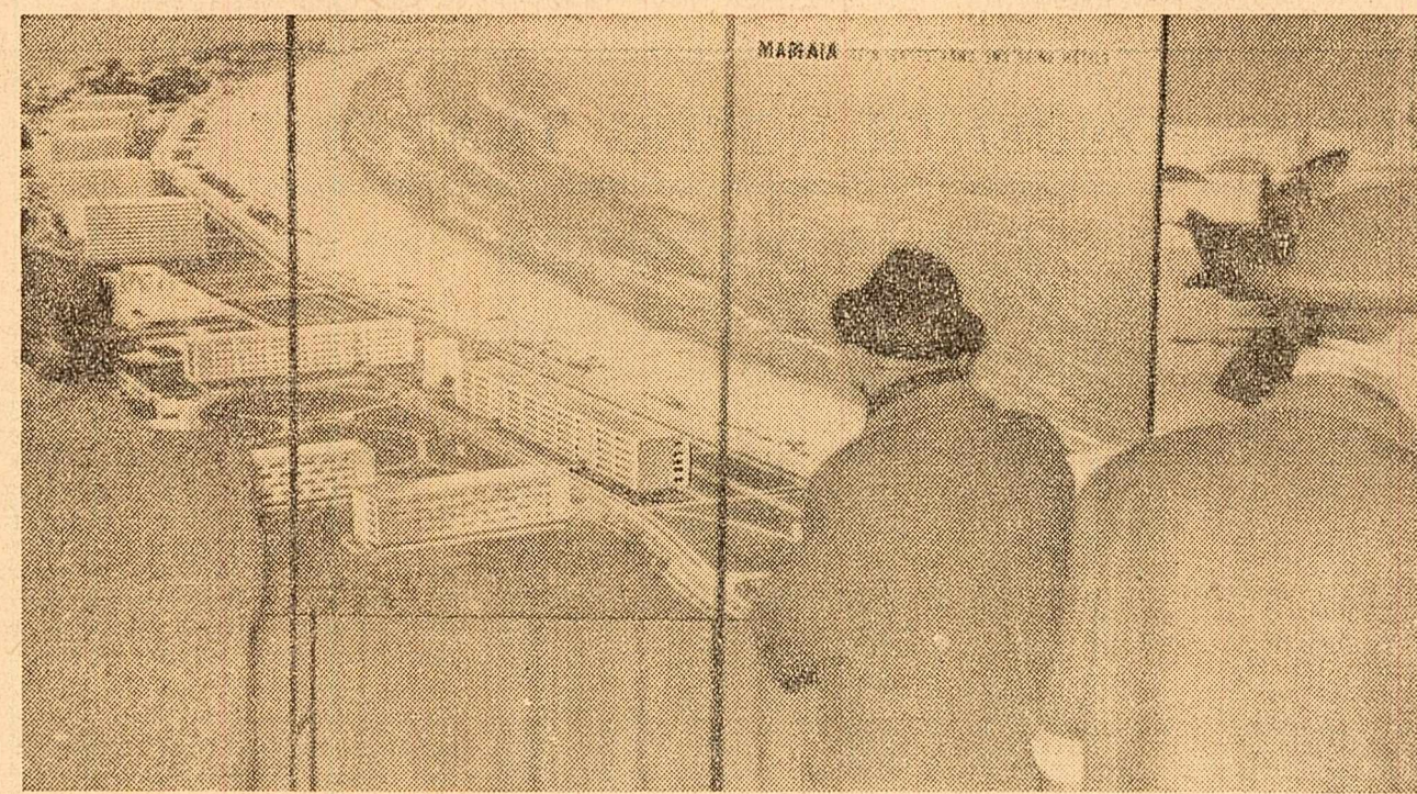
La expoziția organizată de O.N.T. Carpați în cadrul Tîrgului Internațional de la Viena.

Față de aspirațiile legitime spre industrializare, dezvoltare economică, spre o viață mai bună a popoarelor din fostele colonii sau teritorii dependente, țara noastră a manifestat și manifestă deplină înțelegere și simpatie. Dezvoltînd comerțul internațional cu toate țările, R.P. Romînil întrefine relații în continuă creș-