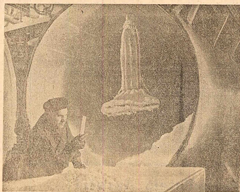
Fabrica „Sinteza” din Oradea. Se iau probe dintr-o șarjă de acid salicilic.