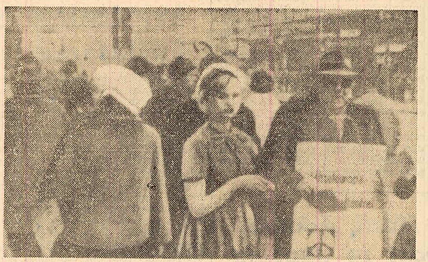
Adversarii ai înarmării atomice din localitatea Heme (R. F. Germană) fac pregătiri în vederea marșului de primăvară pentru pace și dezarmare

Sianuk a adresat de asemenea, scrisori lui N. S. Hrușciov și lui de Gaulle în care le cere să convingă guvernele Angliei și Statelor Unite să accepte organizarea fără întîrzieră a unei conferințe pentru garantarea neutralității Cambodgiei.