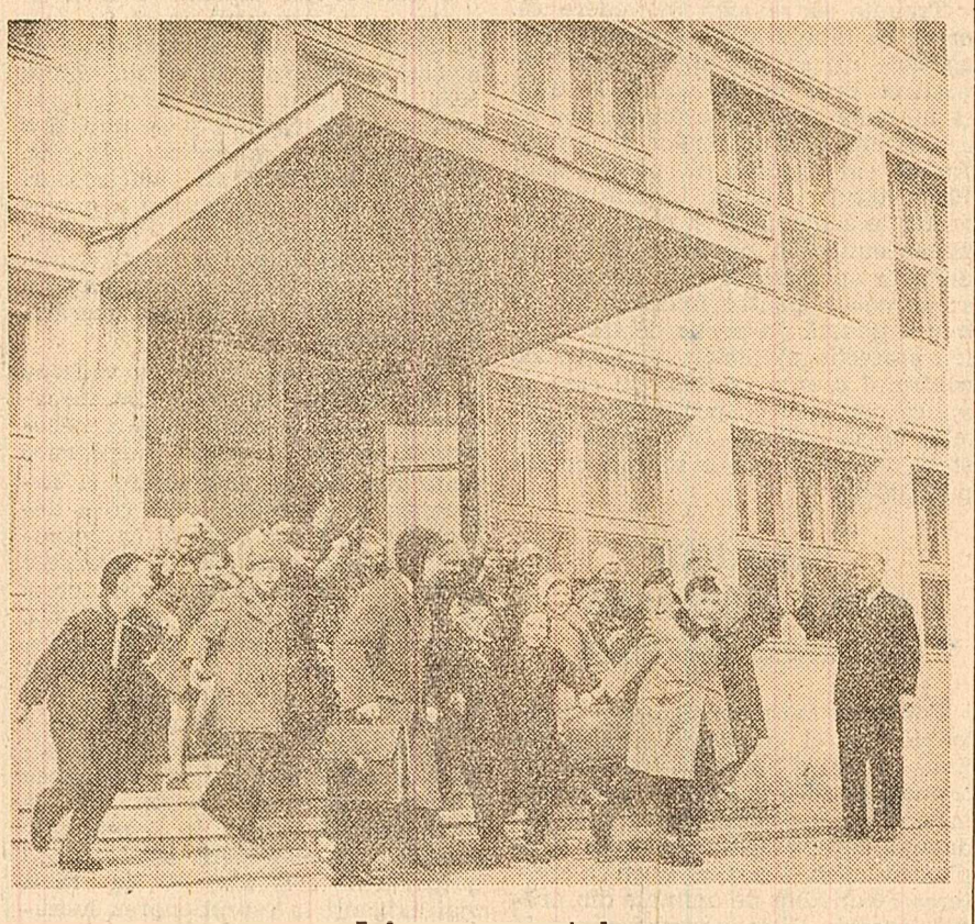
A început vacanța!