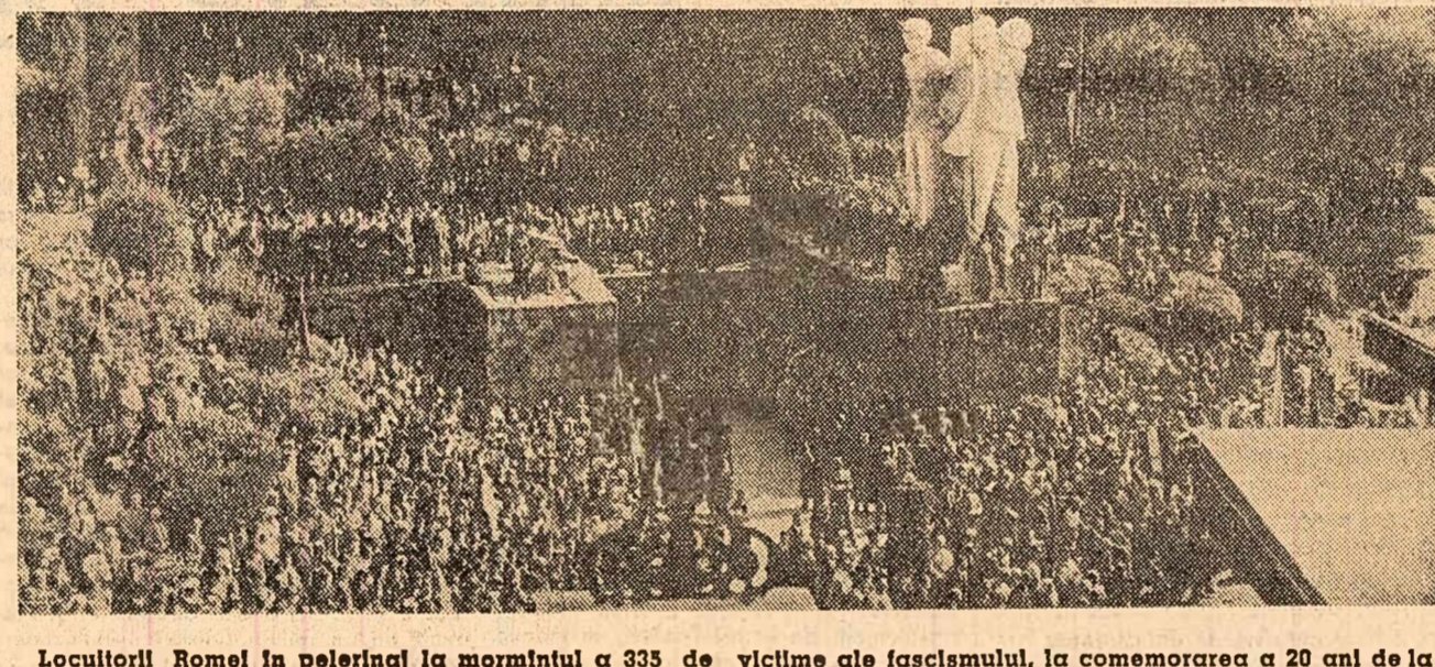
Locuitorii Romei în pelerinaj la mormântul a 333 de victime ale fascismului, la comemorarea a 20 ani de la asasinarea lor. Ceremonia a avut loc în prezența președintelui republicii, Antonio Segni, și a președintelui Consiliului de Miniștri, Aldo Moro.

Purtătorul de cuvânt a precizat că aceste consultări se referă la actualitatea convocării conferinței de la Geneva în vederea consacării internaționale a neutralității Cambodgiei precum și la ansamblul problemelor privind Cambodgia.