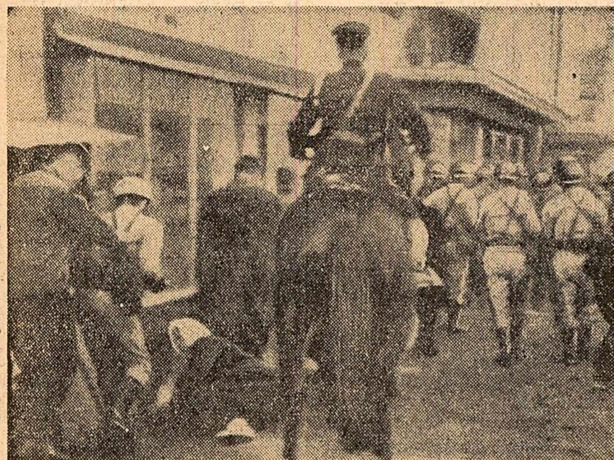
La Seul, în timpul demonstrațiilor

SEUL 27 (Agerpres). — Vineri dimineață pe străzile Seulului precum și în alte câteva orașe importante ale Coreei de sud, 20.000 de studenți au ieșit din nou să demonstreze împotriva tratatelor de la Tokio pentru așa-zisă „normalizare” a relațiilor japono-sud-coreene.