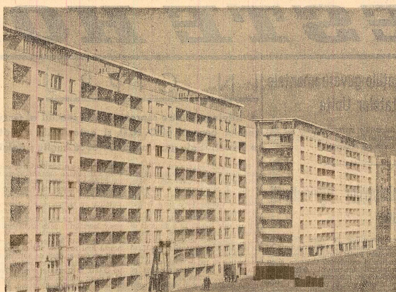
Decor nou la Piatra Neamț