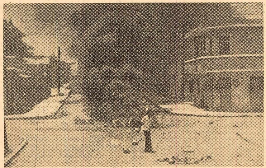
În timpul recentelor tulburări de la Santo Domingo

BAGDAD. Tribunalul militar a pronunțat sentința în procesul foștilor membri ai „gărzii naționale” baasite din localitatea Diwanieh, situată la sud de Bagdad. Un acuzat a fost condamnat la moarte, patru la închisoare silnică pe viață, iar șase la închisoare pe termene între 3 și 15 ani.