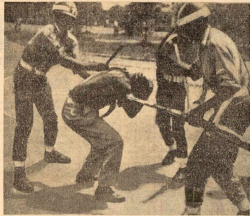
Soldați din trupele guvernamentale maltratează un partizan congolez la Leopoldville

MOSCOVA 19 (Agerpres). — La 19 mai au avut loc funeraliile lui Otto V. Kuusinen, membru al Prezidiului C.C. al P.C.U.S. În cursul dimineții, oamenii muncii din Moscova au venit la Sala Concinerilor din Casa Sindicatelor pentru a-și lua ultimul rămas bun. În Piața Roșie a avut loc un miting de doliu, după care urma cu cenzura lui Otto Kuusinen a fost așezată într-o nișă din zidul Kremlinului.