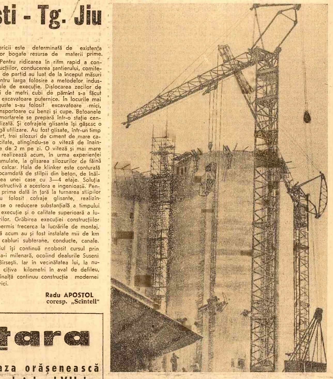
Silozurile de ciment construite cu ajutorul cotrajelor glisante