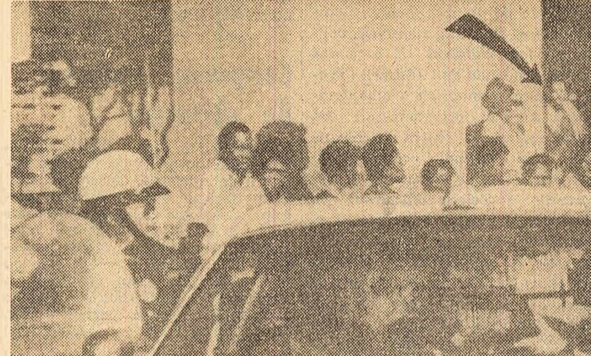
Informația prin care ziarul „New York Herald Tribune” a anunțat pe o pagină întreagă publicarea acestei fotografii, este considerată „probabil cea mai controversată fotografie a deceniului”.

a ministrului vest-german al apărării, nu s-a publicat nici un comunicat oficial. Ziarele engleze au scris că Anglia s-ar putea să încheie cu R.F. Germania acorduri de livrare de armament care să compenseze, într-o oarecare măsură, cheltuielile de întreținere a forțelor militare engleze în R.F.G.