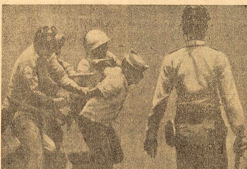
La Santo Domingo, capitala Republicii Dominicane, au avut loc recent mari demonstrații antigovernamentale. Poliția a intervenit cu brutalitate, oprind arestării.

WASHINGTON 15 (Agerpres). — Agențiile de presă americane anunță că guvernatorul statului Pennsylvania, William Scranton, a început un turneu în diferite state ale S.U.A. pentru a obține sprijin în favoarea candidaturii sale la convenția Partidului republican din iulie, care va desemna candidatul prezidențial.