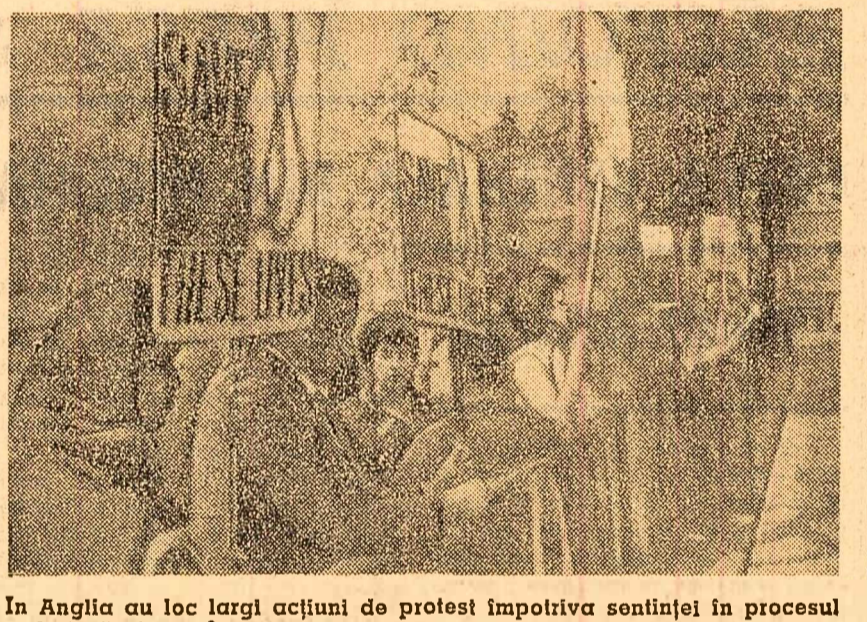
În Anglia au loc largi acțiuni de protest împotriva sentinței în procesul de la Pretoria. În fotografie: aspect de la demonstrația din Londra

LONDRA. — Într-o declarație făcută în Camera Comunelor, ministrul afacerilor externe englez, R. A. Butler, a afirmat că guvernul britanic deplănge sentințele de condamnare la închisoare pe viață pronunțate de tribunalul din Pretoria împotriva lui Nelson Mandela și a celorlalți luptători pentru eliberarea populației africane din Republica Sud-Africană.