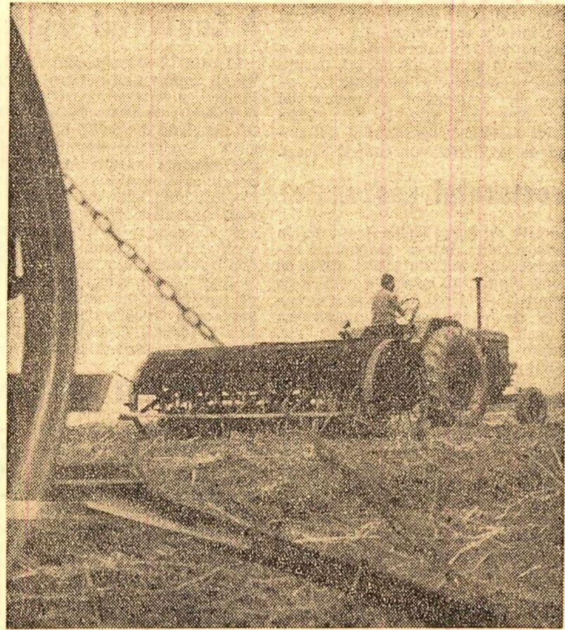
La G.A.C. Otopeni se însămînțează porumb furajer pe terenul de pe care s-a recoltat orzul

În această perioadă, în gospodăriile de stat și gospodăriile colective se execută numeroase lucrări menite să ducă la asigurarea bazei furajere. Recoltarea în faza optimă de dezvoltare a plantelor de nutreț cultivate, cositul fînurilor naturale, stringerea cu grijă a tuturor resurselor de furaje constituie acțiuni importante pentru îmbunătățirea hrănilor animalelor. Plouile căzute în ultimul timp au creat condiții ca în acest an să se obțină cantități mari de nutrețuri și prin însămînțarea culturilor furajere pe terenurile de pe care s-au recoltat cerealele păioase. Ținând seama de aceasta, în numeroase unități agricole socialiste din regiunile București, Dobrogea, Oltenia, Crișana și altele munca la recoltarea cerealelor a fost în așa fel organizată încît noaptea tractoarele ară terenul pentru a putea fi însămînțat imediat cu porumb pentru masă verde, porumb pentru siloz etc. Așa se procedează la gospodăriile de nutrețuri și prin însămînțarea culturilor furajere pe terenurile de pe care s-au recoltat cerealele păioase. Ținând seama de aceasta, în numeroase unități agricole socialiste din regiunile București, Dobrogea, Oltenia, Crișana și altele munca la recoltarea cerealelor a fost în așa fel organizată încît noaptea tractoarele ară terenul pentru a putea fi însămînțat imediat cu porumb pentru masă verde, porumb pentru siloz etc. Așa se procedează la gospodăriile de nutrețuri și prin însămînțarea culturilor furajere pe terenurile de pe care s-au recoltat cerealele păioase.