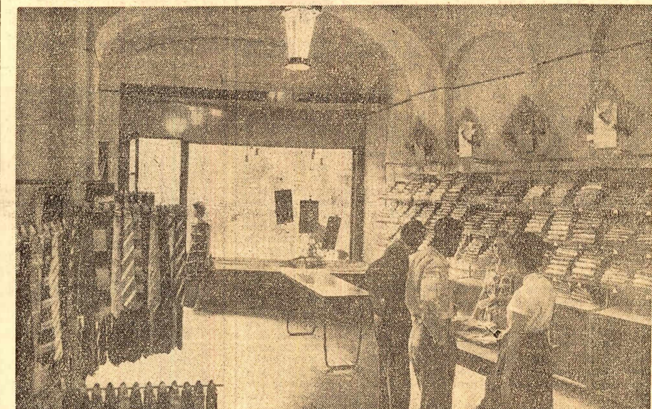
Magazinul specializat pentru vânzarea cămășilor și cravatelor din Bd. 1848, din București