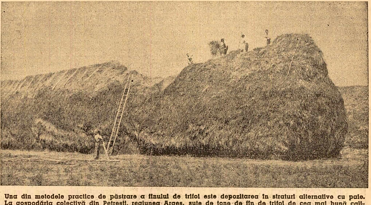
Una din metodele practice de păstrare a fînului de trifol este depozitarea în straturi alternative cu paie. La gospodăria colectivă din Petrești, regiunea Argeș, sute de tone de fîn de trifol de cea mai bună calitate sînt strînse în șire

agricol raional Slatina. Rezultatele obținute sînt foarte bune. Dacă suprafața de teren din raion destinată producției de nutrețuri verzi ar fi folosită numai ca pășune naturală, s-ar putea hrăni cel mult 7 000 unități vită mare, adică numai 39 la sută din efectivul de taurine și ovine. În condițiile pedoclimatice locale, pașiștile naturale dau numai 3 000-5 000 kg de masă verde la ha. Prin cultivarea plantelor furajere de mare randament se obțin 20 000-30 000 kg de masă verde la ha și chiar mai mult. Cu această cantitate pot fi hrănite în timpul verii pînă la 5 vaci sau 20-27 de oi, de cîteva ori mai mult față de cit puteau fi hrănite în trecut pe aceeași suprafață. Astfel de rezultate se obțin la gospodăriile colective din Scornicești, Brebeni, Teslui, Oporelu, Brîncoveni și altele.