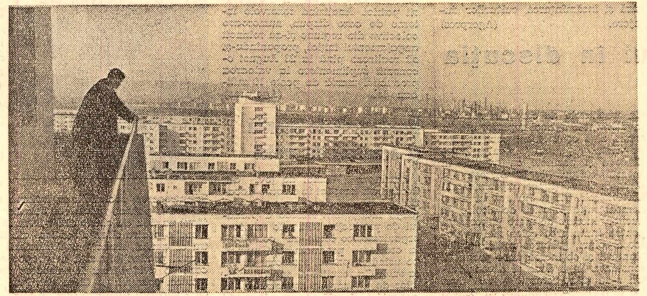
Cîteva dintre blocurile de locuințe construite în ansamblul de pe Bd. Republicii din Ploiești

oară pe șoseaua națională dinspre Cimpina. La alegerea amplasamentului noului cartier s-a avut în vedere existența unui teren liber, fără să fie necesare demolări, teren care a permis o dezvoltare a întregii arhitecturii fără a fi îngreunată de anumite elemente existente. Un punct de vedere arhitectural, urbanistic, la acest nou complex s-a căutat să se creze o mai mare diversitate în rezolvarea plastică a blocurilor, care evită monotonia prin colorit, elemente de detaliu (balcoane, intrări, traforuri etc.), precum și prin modul în care s-au amplasat blocurile de 5 nivele și a accentelor de 10 nivele. Fiind vorba de un complex care va găzdui aproape 25 000 de locuitori, D.S.A.P.C.-Ploiești a avut în vedere ca cei care se vor muta în cartierul Ploiești-nord să beneficieze de tot ceea ce trebuie să le satisfacă necesitățile zilnice. Aici s-au prevăzut și se construiesc două etaje). Socotesc, de altfel, că este bine ca în anumite părți ale orașelor să se studieze posibilitatea amplasării de locuințe cu mai puține nivele; asemenea construcții pot fi chiar în-