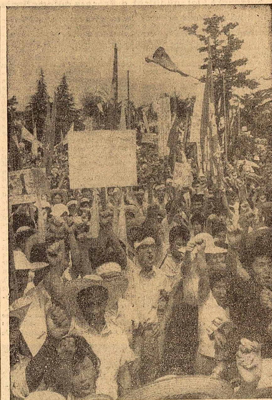
Aproximativ 18 000 de muncitori japonezi au organizat recent, în apropiere de Tokio, o demonstrație pentru pace și dezarmare

cane de a se convoca de urgență o conferință constituțională privitoare la viitorul Rhodesiei de sud, la care să participe lideri ai tuturor partidelor și organizațiilor africane din această colonie. Președintele Republicii Ghana, Kwame Nkrumah, și Albert Margai, primul ministru al statului Sierra Leone, au invitat statele membre ale Commonwealthului să adopte „o atitudine comună” în rezolvarea problemei sud-rhodesiene, precum și a problemelor coloniale din Africa și din alte părți ale lumii. O altă problemă ridicată în ședințele de joi a fost aceea a relațiilor dintre statele industriale și țările în curs de dezvoltare din cadrul Commonwealthului. Președintele Nkrumah și alți șefi ai guvernelor africane au preconizat adoptarea „unei atitudini comune și active”. Ayub Khan, președintele Pakistanului, a declarat în acest sens că țările industriale „trebuie să ajute țările în curs de dezvoltare, având sarcina de a ridica în primul rând standardul de viață al acestor popoare”.