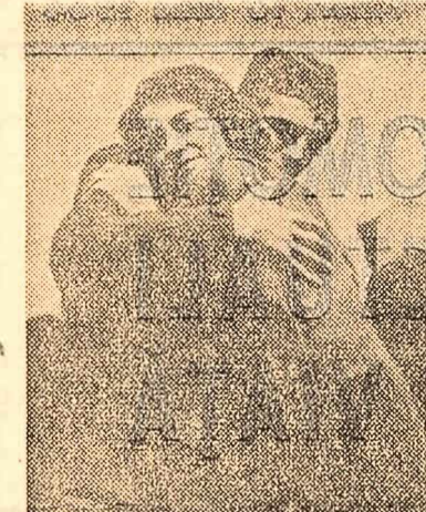
Cineștii iugoslavi evocă în „Kozara” evenimentele petrecute în anii războiului. Kozara era, în 1942, una din acele regiuni libere care rezistaseră invadatorilor. Refugiul în codrii Kozarei, zeci de mii de locuitori și soterii din împrejurimi au continuat să trăiască năsușii trupelor ocupante, viața lor liberă fiind străjuită cu fermitate și abnegație de luptătorii partizani. Filmul regizoratului Veljko Bulajic reînvie pe peliculă momente ale ofensivei hitleriste asupra muntelui Kozara, episoade în care eroismul apărătorilor Kozarei, spiritul lor de sacru și curaj se definesc pregnant, în secvențele memorabile.

Filmul atinge momente culminante în marile sale scene de masă. Jurămîntul partizanilor de a apăra pînă la moarte locuitorii și ținutul Kozarei, spargerea încercării fasciste sau alacului aerian, cîntecul final de răscollor trăgîm ai celor rămași în viață — sînt cîteva din momentele cele mai emoționante ale filmului. Regizorul Veljko Bulajic se dovedește a fi un excelent maestrul al colectivității pe ecran, reușind să dea viața și relief îndeeșilor scenelor de largă respirație. Faptele de viață din scenariu sînt înfășurate (cu excepția unor intermezzo-uri lirice) într-o compoziție cinematică originală, de un autentic și profund dramatism. Adesea scenele de luptă au veridicitate documentară și acest respect pentru autenticitate reconstruiește cadrul cinematografic constituie, credem, unul din factorii hotărîtori în reușita creatorilor iugoslavi.