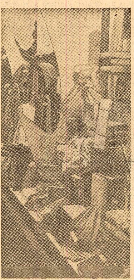
Un colț al expoziției

În clădirea Școlii profesionale de întreprinderi „Filatura românească de bumbac” este deschisă expoziția școlilor profesionale, tehnice și tehnice de mașini ale Ministerului Industriei Ușoare. O hartă a țării, cu becuri de diferite culori, ilustrează dezvoltarea rețelei de școli profesionale, tehnice și tehnice de mașini din această ramură. Pînă în prezent au absolvit școlile profesionale 39 700 tineri, cele medii tehnice 3 200, cele de mașini 1 600, iar cele tehnice 560. În mai multe săli sînt expuse numeroase articole realizate de elevi. Rețin atenția tricotatele de damă, costumele de copii, diferitele țesături și stofe realizate de elevii școlilor din București, Timișoara, Lugoj, Arad, Oradea, Bihor, Sibiu. Tot aici se prezintă câteva modele de încălțăminte de damă, de copii și bărbai, produse de marochinerie etc.