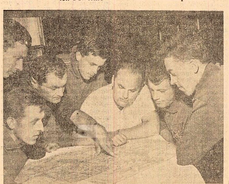
Zi de odihnă. Viitoarea etapă se parcurge, deocamdată, pe hartă