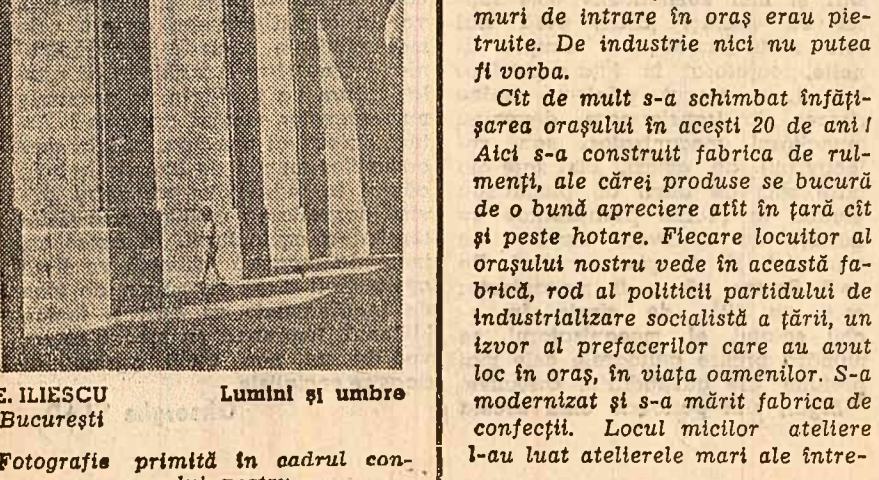
E. ILIESCU București Lumini și umbre Fotografii primite în cadrul concursului nostru