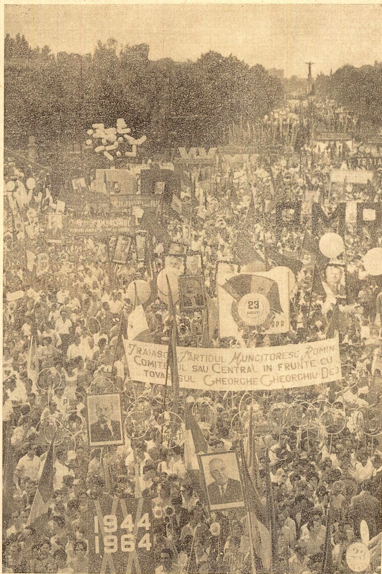
Ceasul din piață arată orele 10 și 10 — iar pînă departe, dincolo de Statuia Aviatorilor, se zărește imensul fluviu omeneșc