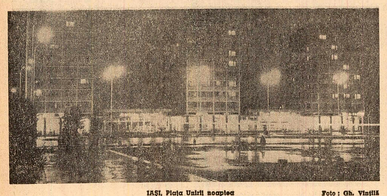
IAȘI, Piața Unirii noaptea