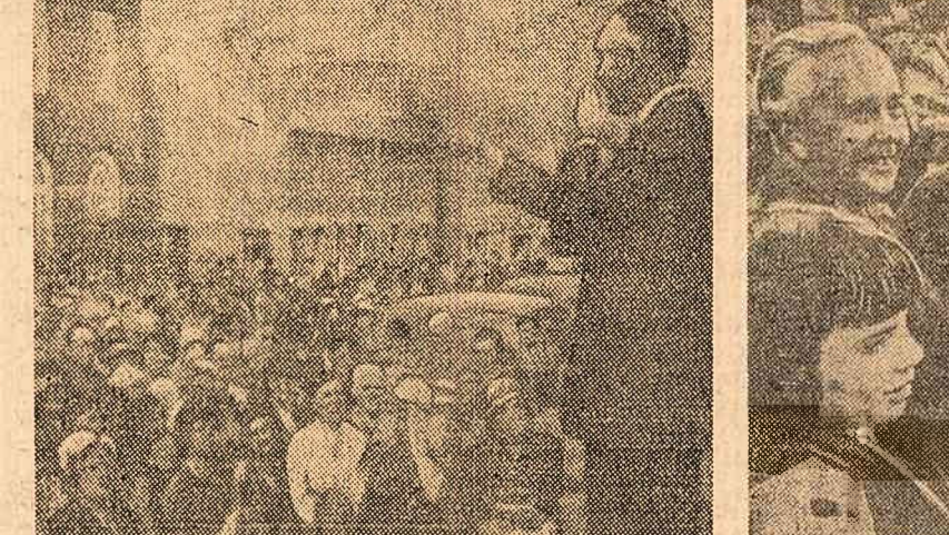
La primele confruntări electorale ale liderilor conservator și laburist cu opinia publică (în dreapta Harold Wilson). Pentru început — zimbeto, de-o parte și alta...

Intr-un discurs rostit la Plymouth, liderul laburist Harold Wilson s-a pronunțat din nou împotriva politicii conservatorilor de creare a unei forțe nucleare de șoc britanice.