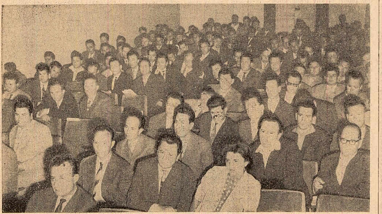
În timpul ședinței secției G.A.S.