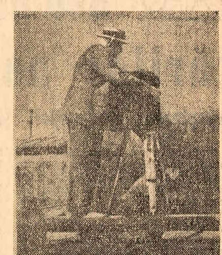
Săptămîna aceasta s-au împlinit o sută de ani de la nașterea lui Louis Lumière...