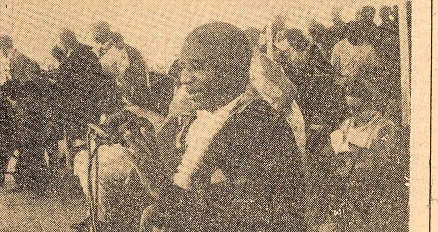
Malawi. Primul ministru Hastings Banda vorbind la o întrunire despre cauzele crizei politice din țară. Se știe că majoritatea membrilor guvernului cu fost demisi sau cu de mislonat