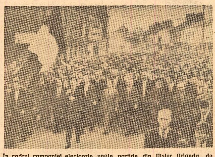
În cadrul campaniei electorale unele partide din Ulster (Irlanda de Nord), care intră în componența Marii Britanii, cer alipirea Ulsterului la Irlanda. Recent, la Belfast, capitala Irlandei de Nord, au avut loc demonstrații în sprijinul acestei revendicări

La bursa londoneză, cursul acțiunilor continuă să scadă, după ce vineri a înregistrat o cădere record de 7,3 puncte, iar pe întreaga săptămîna — de 20,7 puncte.