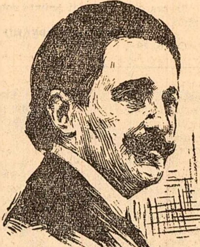
100 de ani de la nașterea lui Nușici