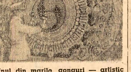
Unul din marile gonguri — artistii încrustate — folosesc în timpul festivității de deschidere a Jocurilor Olimpice