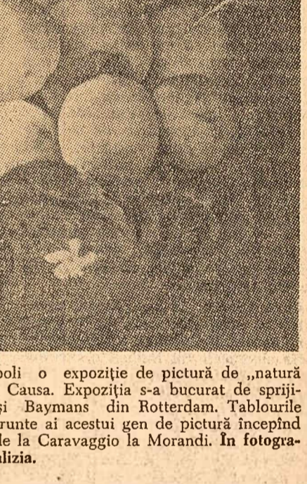
La 5 octombrie s-a deschis la Napoli o expoziție de pictură de „natură statică” sub conducerea lui Raffaello Causa...