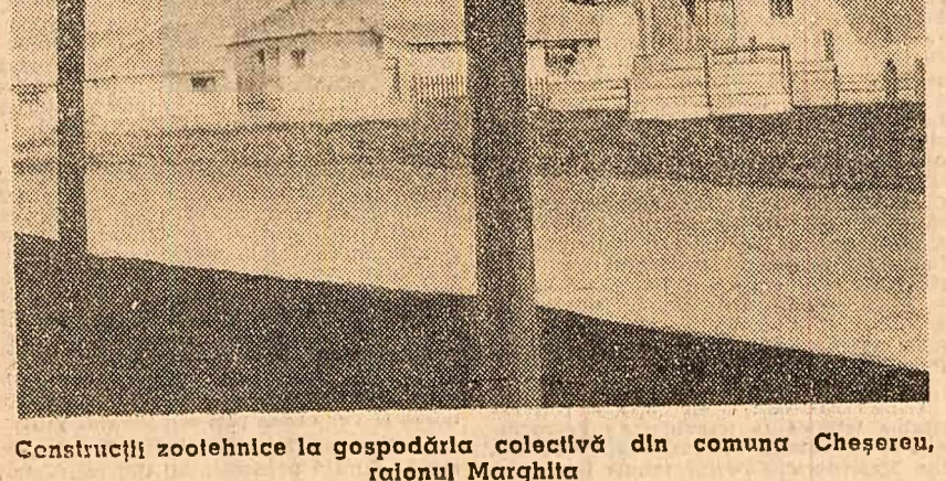
Construcții zootehnice la gospodăria colectivă din comuna Cheșereu, raionul Marghita

Dezvoltarea gospodăriilor colective depinde în măsură hotărîtoare de întărirea organizațiilor de partid, de ridicarea nivelului muncii lor politice și organizatorice, de capacitatea lor de mobilizare a colectivității la îndeplinirea sarcinilor de sporire a producției agricole vegetale și animale.