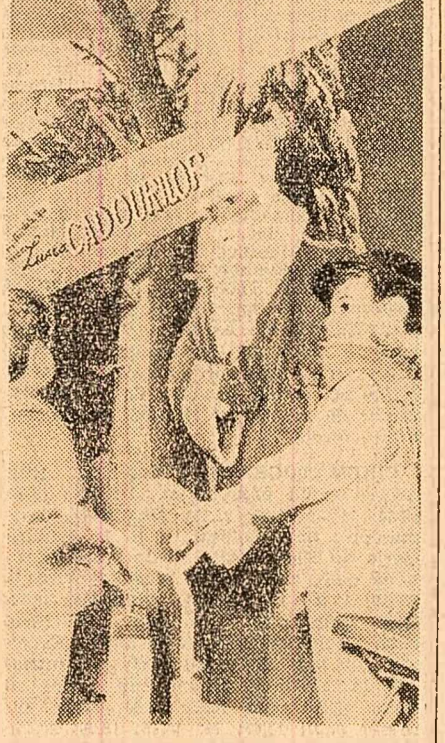
Moș Gerila a și poposit în vitrina magazinului universal „București”.