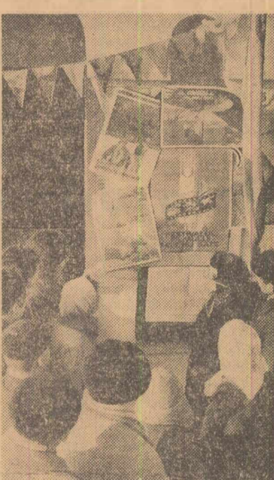
Se anunță filme noi la cîntinul cultural din comuna Otopeni de lângă București.

Experiența pozitivă acumulată pînă acum merită să fie larg generalizată în cea de-a doua etapă a Festivalului filmului pentru sate, care începe duminică. În același timp, comitetele de cultură și artă, întreprinderile cinematografice sînt chemate să ia măsuri pentru a preîntîmpina repetarea unor neglijențe semnale în desfășurarea primei etape. Astfel, e necesar să fie respectate riguros programările pentru a nu se