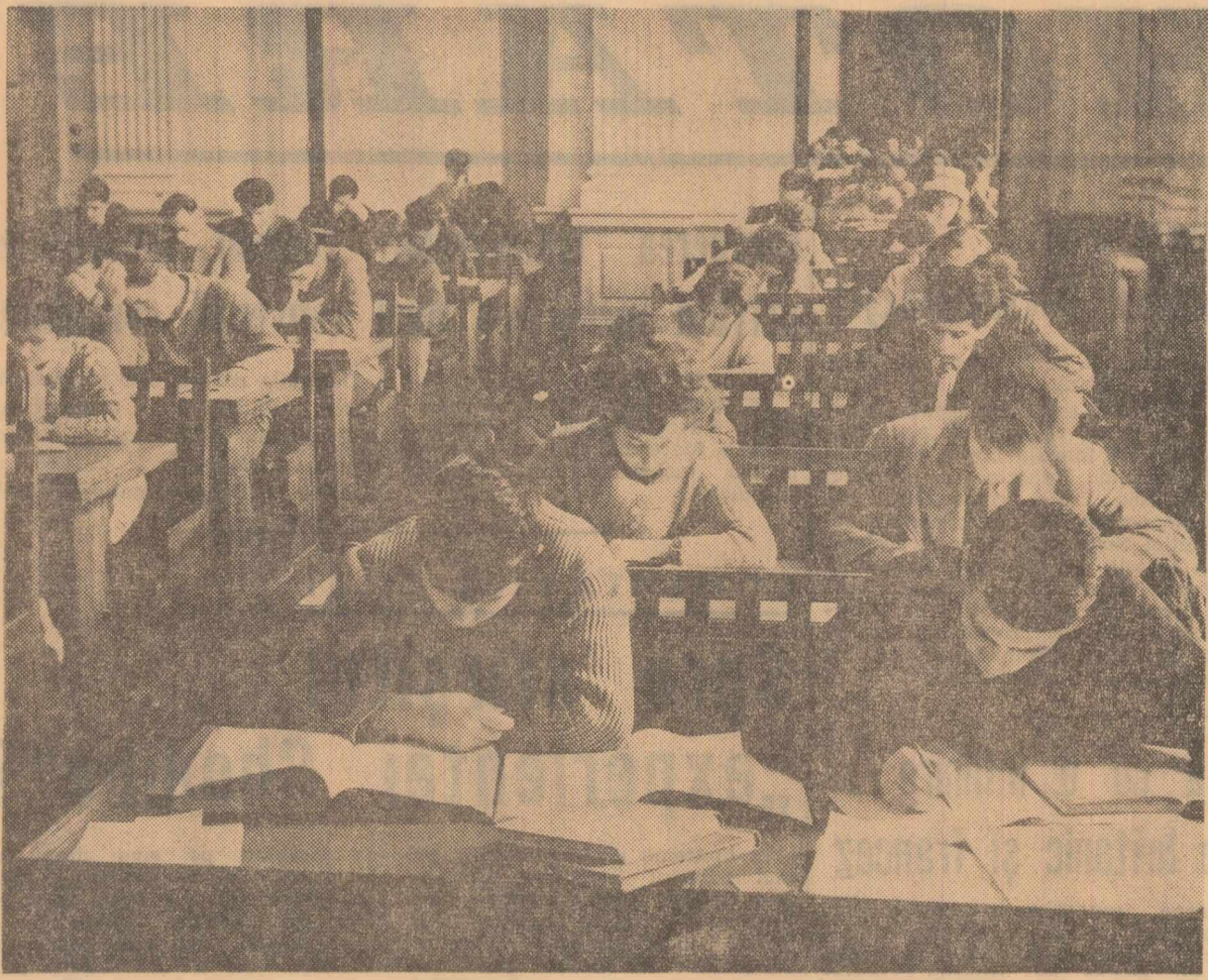
In aceste zile, Biblioteca centrală universitară este mult solicitată de studenți aflați în perioada de pregătire a examenelor