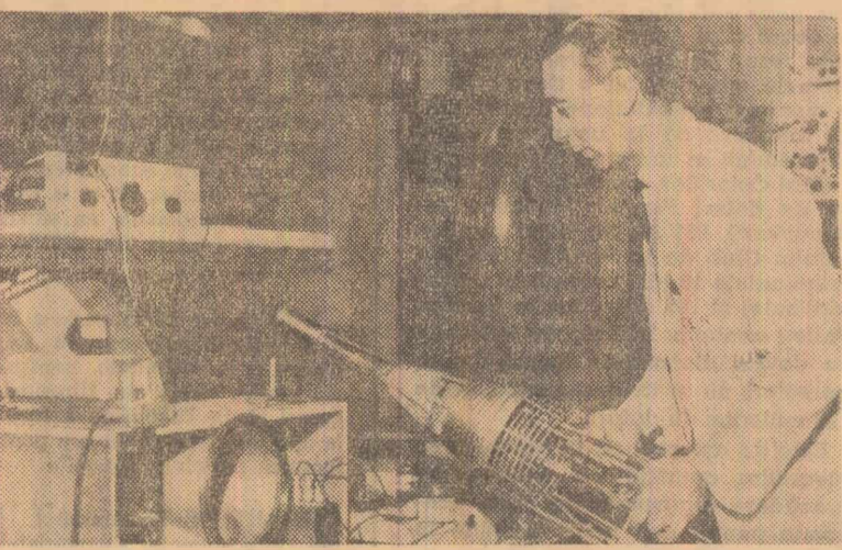
La Saclay (Franța) a fost realizată o țintă de protoni polarizați care permite o mai bună aprofundare a structurii întîme a materiei. Experimentele s-au făcut la temperaturi apropiate de zero absolut

În presa occidentală se relatează că Hollywood este pe cale de a deveni un „oraș interzis” pentru actorii străini. De curînd „Screen Actor Guild”, sindicatul american al actorilor de film, a obținut ca contractele cu străinii să fie împuținate, ceea ce va atrage după sine micșorarea numărului actorilor străini angajați la studiourile din Hollywood.