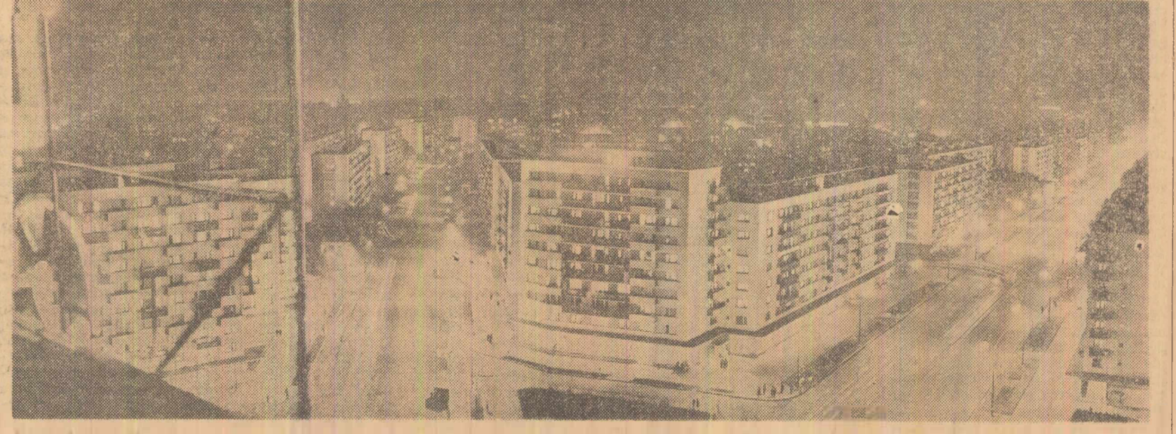
Imagine nocturnă (la înfîlînirea bulevardului 1 Mai cu Calea Grîvilei din Capitală).

La 19 ianuarie a.c. se va întruni la Varșovia Comitetul Politic Consultativ al statelor participante la Tratatul de la Varșovia. (Agerpres)