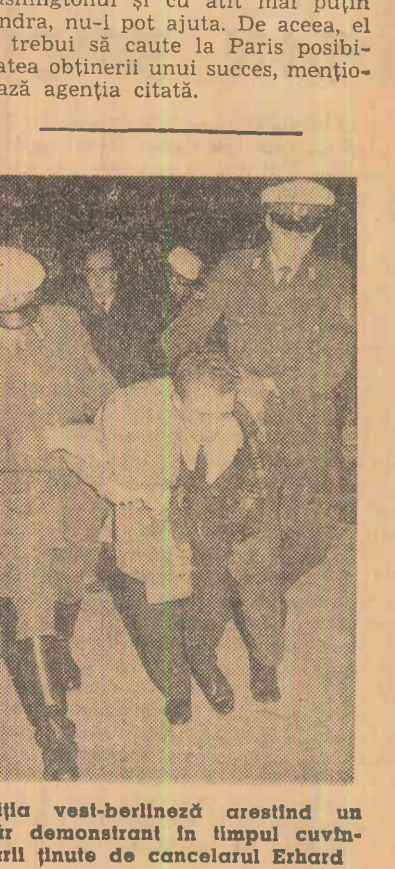
Poliția vest-berlineză arestînd un tânăr demonstrant în timpul cîmbușliilor ținute de cancelarul Erhard

În vederea alegerilor, cancelarul vest-german are nevoie de un succes în politica externă. Dar, cu toate eforturile depuse de cînd a ajuns șef al guvernului, el nu a reușit să-l obțină. În situația actuală, nici Washingtonul și cu atât mai puțin Londra nu-l pot ajuta. De aceea, el va trebui să caute la Paris posibilitatea obținerii unui succes, menționînd agenția citată.