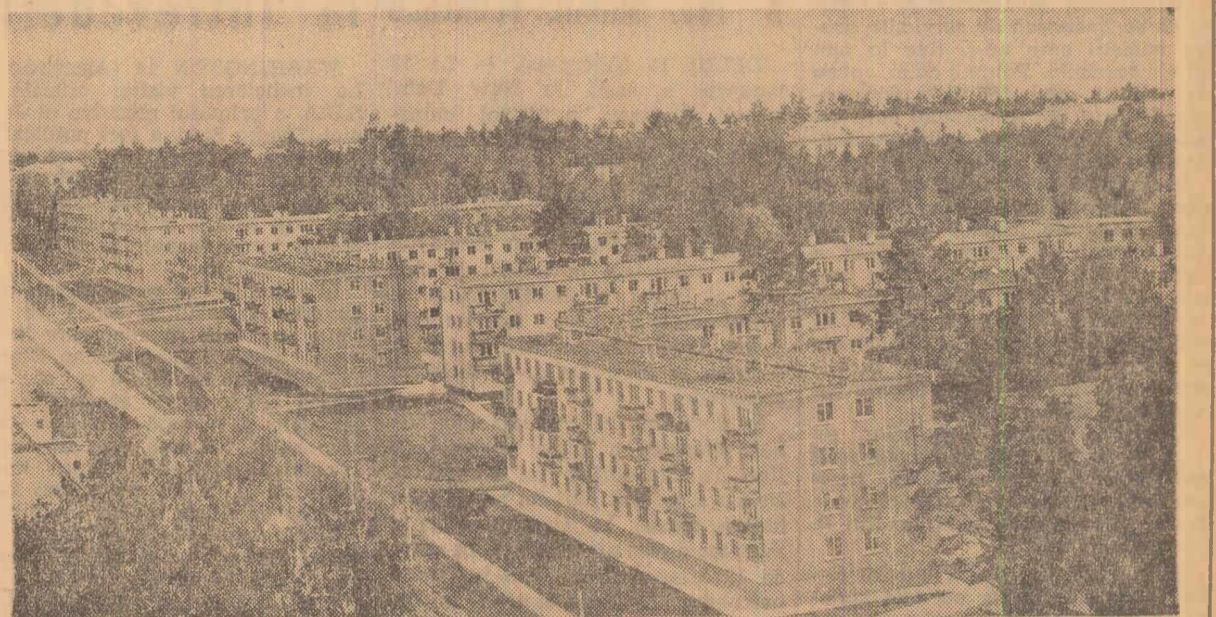
În orașul Ilicalei din Siberia a Academiei de Științe a U.R.S.S.

În localitatea Obilici Kosovo (R.S.F. Iugoslavia) a intrat recent în funcțiune o nouă fabrică de materiale electrice. Ea contribuie la dezvoltarea industrială a acestei regiuni, a cărei populație se ocupă înainte de război exclusiv cu agricultura. Fabrica dispune de un înalt grad de mecanizare.