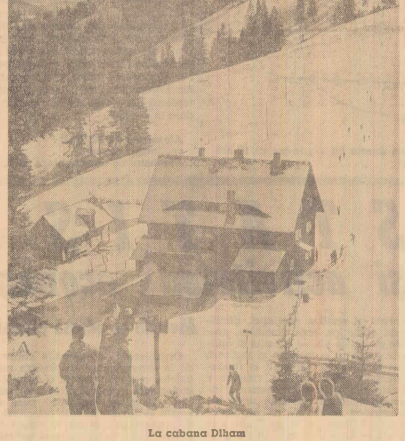
La cabana Dlhamb