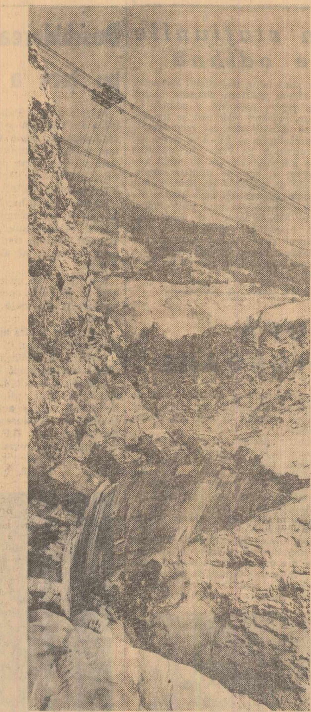
Text: Ion MĂRGINEANU