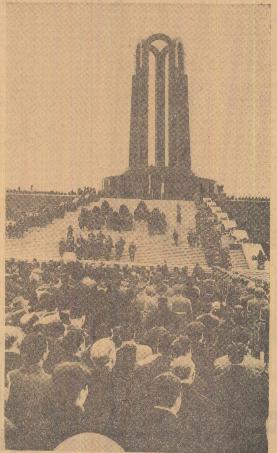
Spre Monumentul eroilor luptei pentru libertatea poporului și a patriei, pentru socialism. Ora 14,20. Precadat de coroanele de flori, scriul acoperit cu steagul roșu și tricolor e purtat pe trepte. În urmă, pînă departe, coloanele de oameni ai muncii